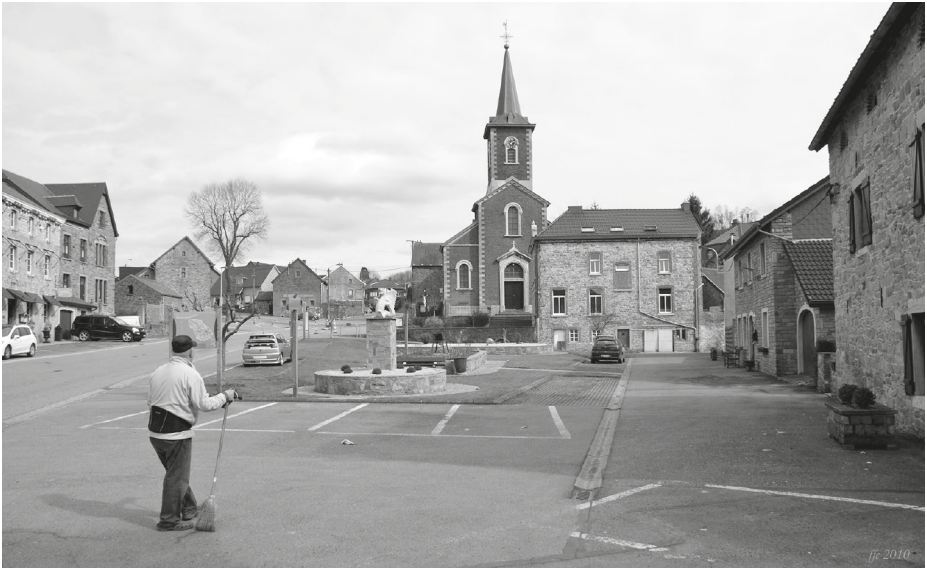
Hodiaŭa Moresneto.

originalaj limŝtonoj en la arbaro. Ankaŭ estas malgranda muzeo en la urbo Kelmizo, kio atestas pri la ekzisto de tia aparta detalo en la eŭropa historio.