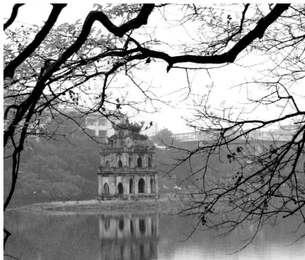
La lago de testudo en Hanojo.