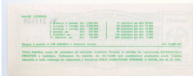
Lice in hrbtišče srečke iz leta 1965

Društvo je nato z zbranim denarjem iz te in podobnih akcij kupilo lastniški prostor na Tavčarjevi 2 v Ljubljani. To je bil edini lastniški prostor esperantistov v Sloveniji, ki so ga poleg društva uporabljali tudi Združenje esperantistov Slovenije in druge organizacije.