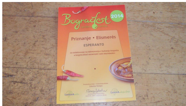
Priznanje turističnega društva »Lendava vabi«