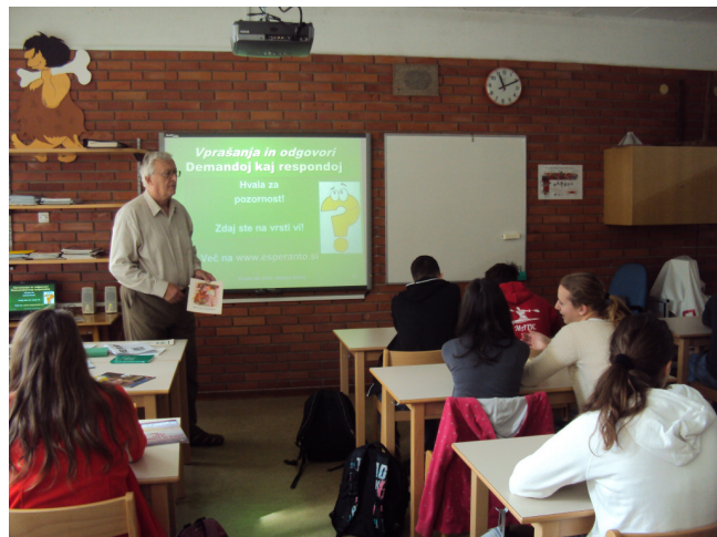
Glasilke Ostoja Kristana so zdržale tri šolske ure

enaka za vse razrede in oba predavatelja, ki sta jo glede na starost poslušalcev in trenutno zanimanje in vprašanja v razredih ustrezno komentirala, razširila ali skrajšala.