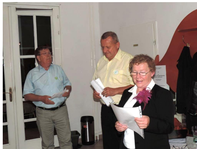
La esperantistoj surscenas