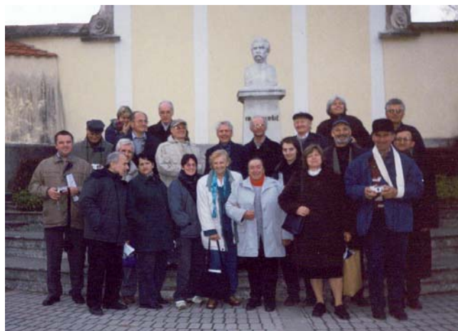
Udeleĝenci dneva Zamenhofa v Ljutomeru

Po ogledu je sledila predstavitev programa dela ZES-a za leto 2004, s katerim smo tudi zaključili sreĉanje.