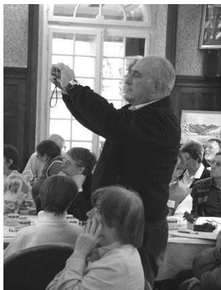
Nia fotisto François Randin (Fotis Keller)

Al tiu kategorio de agnosko apartenas, laŭ la opinio de Carlevaro, la personoj, kiuj partoprenas la vivon de la movado, apoge al la Eo-idearo (aŭ -idealoj), sed kiuj ne bone konas la lingvon. Ili konsideras sin esperantistoj kaj estas supozeble ankaŭ konsiderataj kiel tiaj fare de la ceteraj "veraj" esperantistoj. Laŭ Carlevaro indus do trovi solvojn por ilin plej utile integri en la movadon.