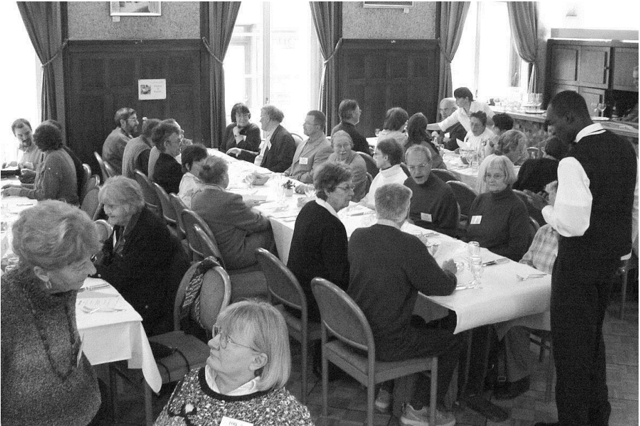
Prepare al la tagmanĝo

Svislando (precipe SG, AR, TG, ZH, AG, LU, BE, BS), la Esperanto-(Eo)-movado ekprosperis en la romanda parto (GE, VD, NE) kaj iom post iom atingis ankaŭ Alemanion. Kiel konate SES fondiĝis en 1903 en Rolle/VD.