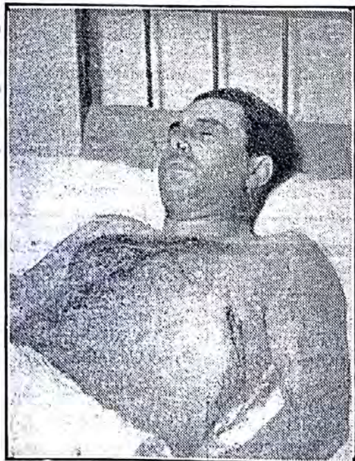
La morte vundita Durruti

C. N. T. ne faris detenan kampanjon. Ĝi faris revolucionan laboron. La laboristoj en sia plimulto voĉdonis.