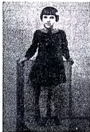
Durruti - Kolette, la filineto de Durruti

niis, ke la batalantoj devas neniam forlasi la laboron. Lia normo estis labori ĉiam. Tage—en la fabriko, nokte—en la sindikato. Kiam li paroladis kontraŭ la politikistoj k la burĝaro, la laboristoj vidis en li kamaradon de laboro, kiu vivis, suferis k batalis kun la laboristoj. La tuta morala aŭtoritato de Durruti radikis ne en tio kion li diris, sed en lia konduto, ĉiam modela k fajra.