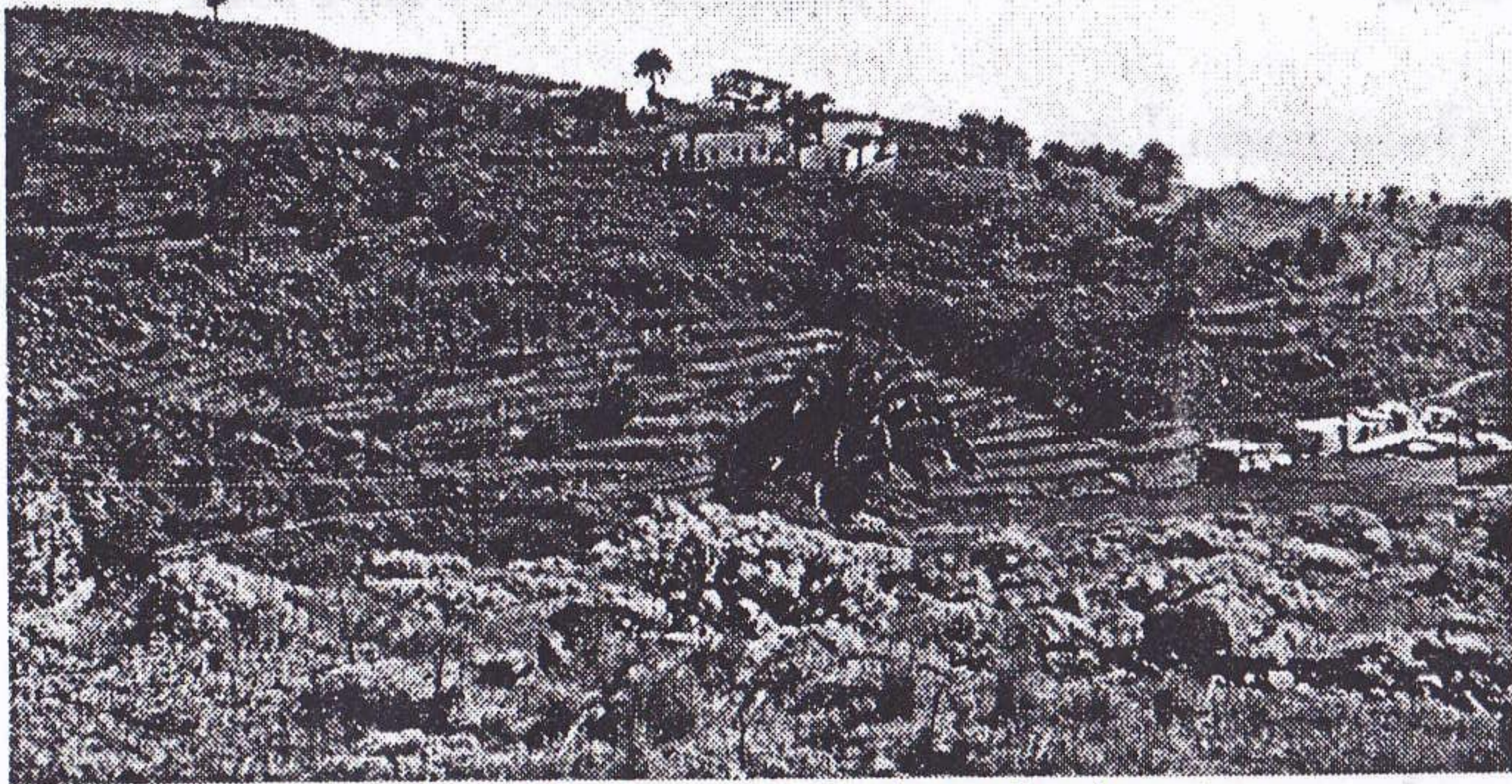
QTH: Videbla en la mezo supren kun la granda palmoanteno