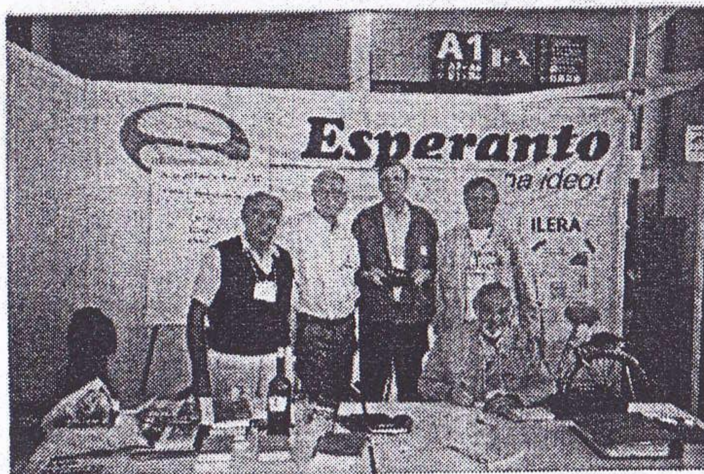
Ham Radio 2004