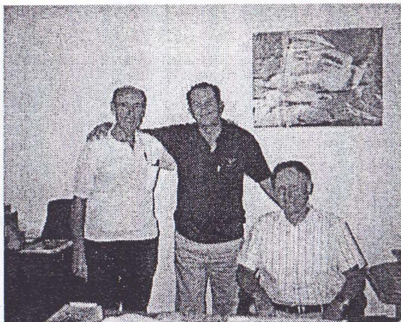
Kubo: maldekstre-dekstren: Ian G-SWL, Pedro CO2RP (Prezidanto de Federación de Radioaficionados de Cuba), Wolf DL1CC kaj Fidel Castro (sur la muro...)