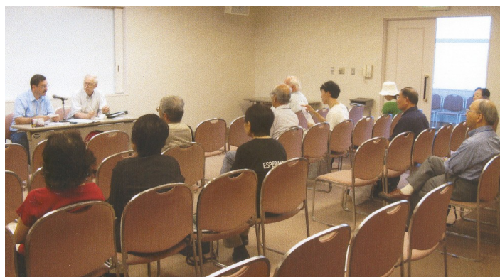
Aŭskultantaro dum la ILERA Jarkunsido 2007