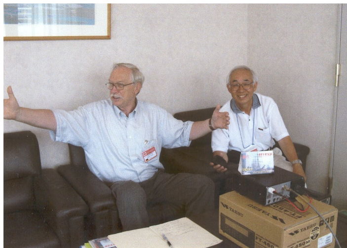
DJ4PG: Mi kaptis fiŝon tiel grandan!