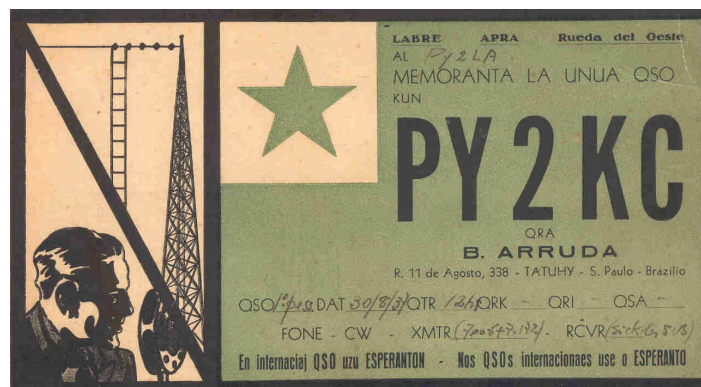
QSL-karto de PY2KC al PY2LA en 1937