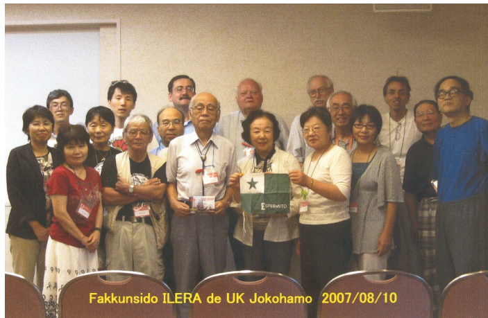
92a UKE en Jokohamo, Japanio