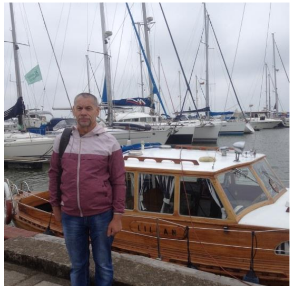
Mi en la ŝiphaveno de Nida