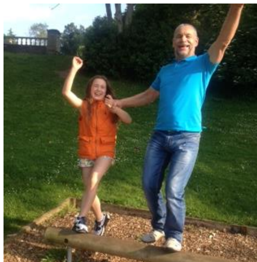
Kun nepino Austina