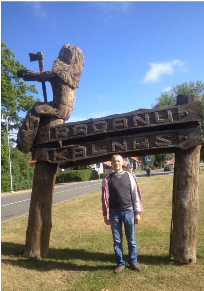
Judkrantė, monto de sorĉistinoj

Redaktoro: Stanislovas Raulynaitis Korektadon okazigis L.Abromas Kontaktoj: klubas.horizontas@gmail.com Tel. Nr. 8-620 21024