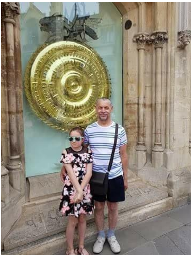
En la urbo Ipswich