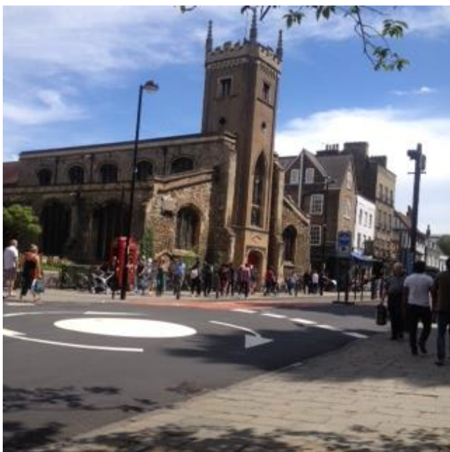
Universitato en Kemabriĝo