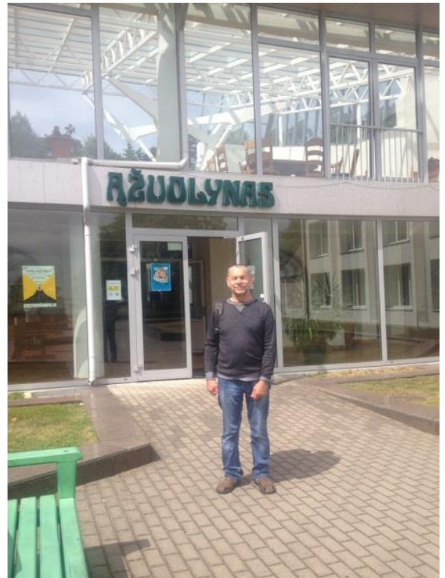
Hotelo Ažuolynas (Ĉi tie ni ripozis)