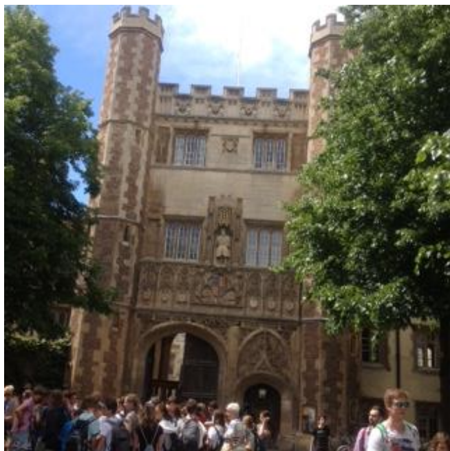
Universitato en Kemabriĝo