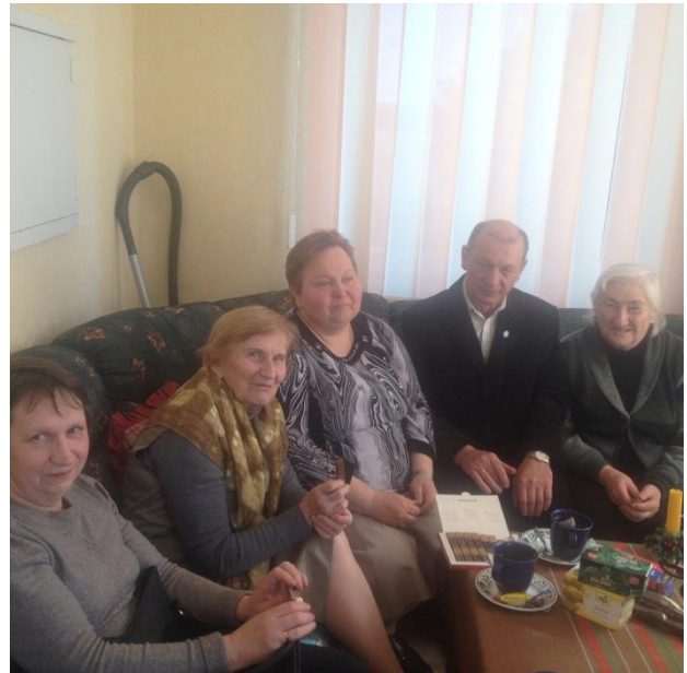
Sur la foto esperantistoj dum kluba kunveno