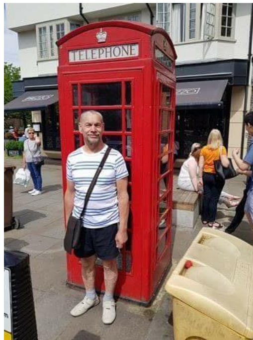
Simbolo de Granda Britujo