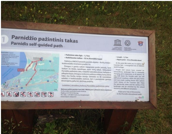
Ekkona pado de Parnidis - duno