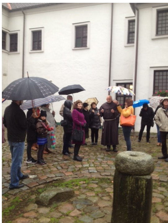
En la korto de monaĥejo de Pranciŝkanoj