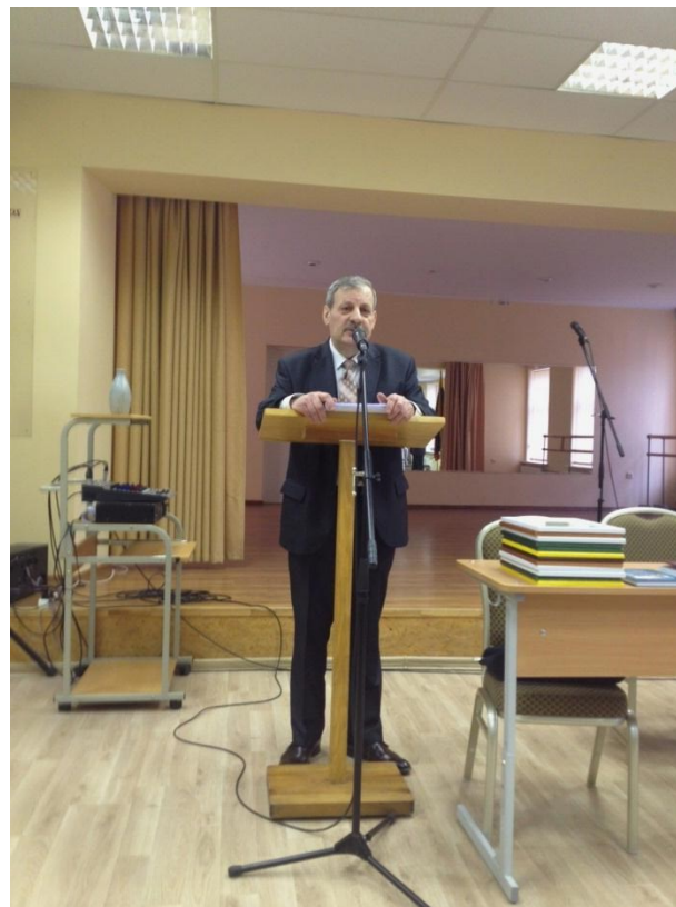
Prezidanto Jegorovas prezentas la agadraporton por 2017.

Dum kongreso oni povis aboni e-revuojn, pagi membrokotizojn. Subskribi al 103-a Universala Esperanto kongreso, kiu okazos en la Lisabono, Portugalio kaj 54aj Baltaj Esperanto Tagoj, kiuj okazos en Estonio