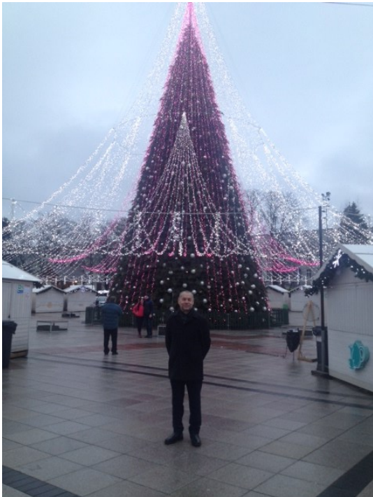
Mi apud Kristnaska arbo.

Antaŭ la Nova jaro mi vizitis Vilnon. Ĝojis mi pri belega Kristnaska arbo. Vizitis mi ankaŭ la Katedralon. Feliĉis mi eblecon partopreni en la Sankta meso. Nia ĉefurbo vere plibeliĝas.