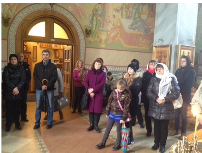
En la Ortodoksa eklezio