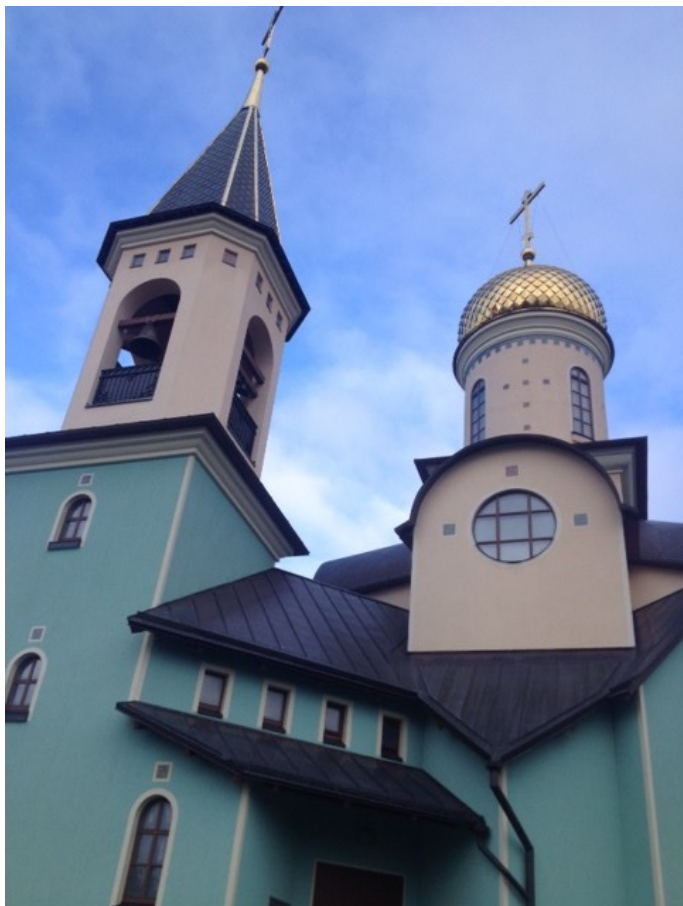
Ortodoksa eklezio en Palanga