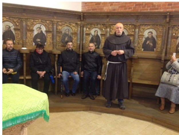
Monaĥo rakontas pri la vivo en monaĥejo de Pranciŝkanoj