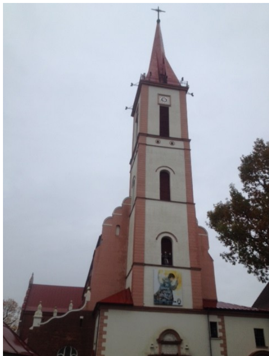
Preĝejo de sankta Mario