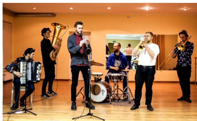
Muzika grupo “Rakija Klezmer Orkestar“.

Vespere okazis koncerto de muzika grupo „Rakija Klezmer Orkestar“.