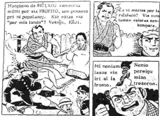
エスペラント語に翻訳された「はだしのゲン」

エスペラント語の最大の 目指す「プラハ宣言」を説 長所は民主的な言葉である 表しています。国境の壁が ことです。また、世界的に 低くなりつつある各、民族、 は少数派の言語と文化を尊 国家に属さないエスペラン ト語によるラジオ放送を 行っている。