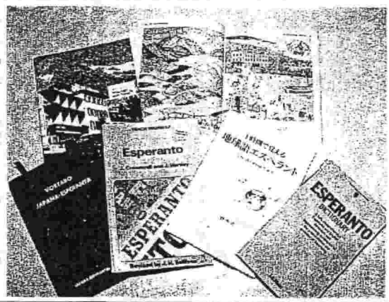
エスペラント語の教本など

札幌市中央区のかぞえ2 「単語がなかなか覚えられ なくて聞かれているエスペラント語講習会」そのま なで「文法ばかりやらずに」と人が住み、民族間の争いが まっくろまっくらのように減って、話す。和やかな雰囲気だ。多 くは単語のしっくを覚える。エスペラント語は、ポー ランド生まれのユタヤ人、あれは」との思いが込めら れ、エスペラントの文字を造る。当時、ポー ランドはロシア領でポーラ ンド人、ロシア人、ドイツ 人が住み、民族間の争いが 多き地域で、「どの国にも 話さないやこい共通語が あれば」との思いが込めら れていた。