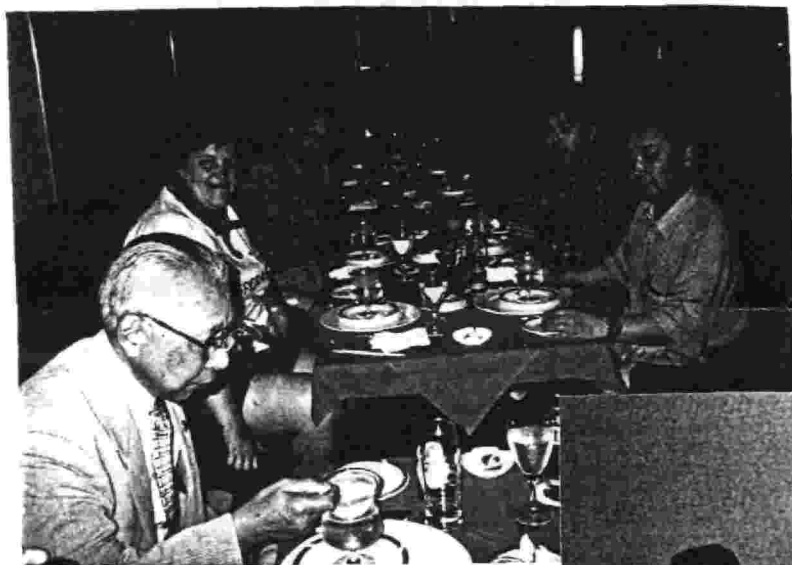
札幌での歓迎会（参加者は20名程度）