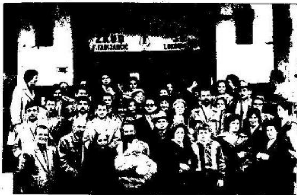
Ceestantoj al la jarkunveno de Esperantista societo "A.Š. Turković" en Rijeka 1961.j, kiu okazigis en la ejoj, de la Kultur-arta societo "F. Fabijanić".