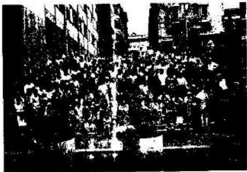
SAT-anoj en 53-a internacia kongreso de SAT en Rijeka, 1980.