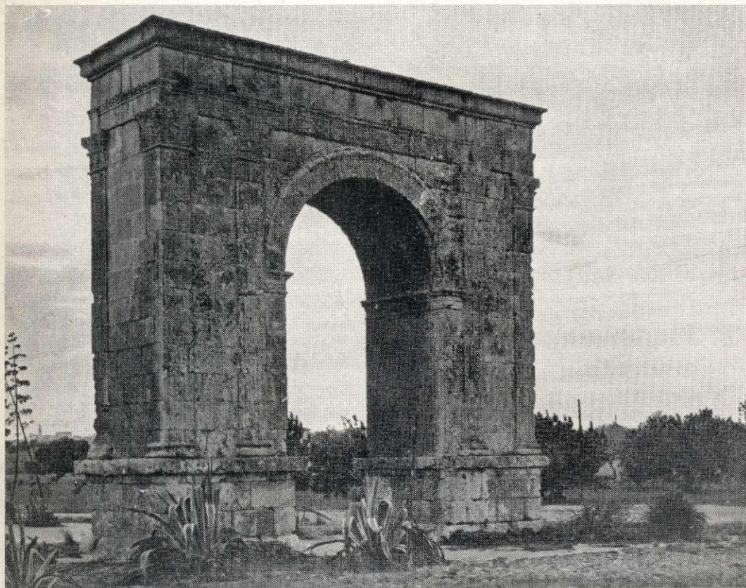
Arkaĵo BARA (II a jarcento) TARRAGONO

Merceria, 7, 3. o - TARRAGONA (Hispanujo)