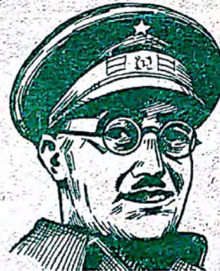
HEROA GENERALO ROJO KONKERISTO DE TERUEL

Depost multaj semajnoj, dum kiuj preskaŭ ĉiuj ĵurnaloj en la mondo publikigis kruelajn profetaĵojn pri la granda ofensivo de Franco, okazis io tute kontraŭe, kio eĉ por la respublikanoj estis granda surprizo.