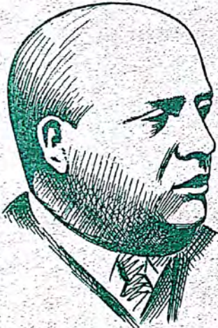
INDALECIO PRIETO, GEN- ERA RESPUBLIKANA MI- NISTRO DE NACIA DEF- ENDO.