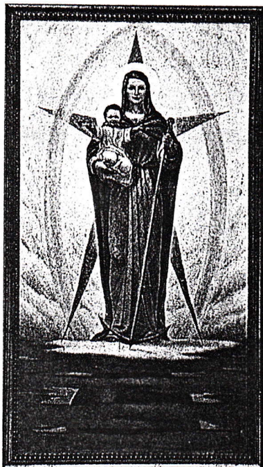
Nia Sinjorino de la Espero Patronino de la Esperantistoj