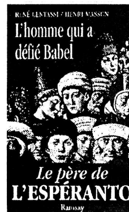
Kovrilpaĝo de tiu libro : 408 p. (Editions Ramsay : 1995)