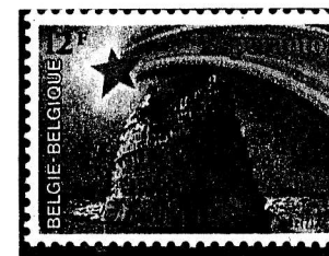
Poŝtmarko de Belgio : 1982 okaze de la 67.a UK .