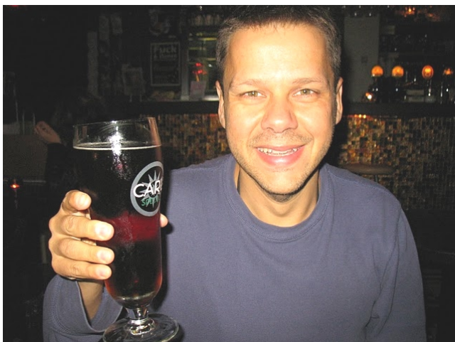
Bonvenon al la nova prezidanto