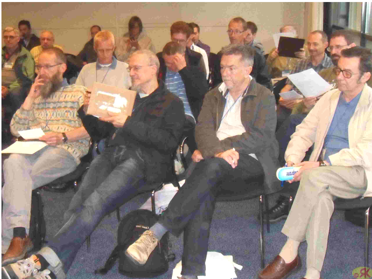
LSG-jarkunveno 2011 en Kopenhago