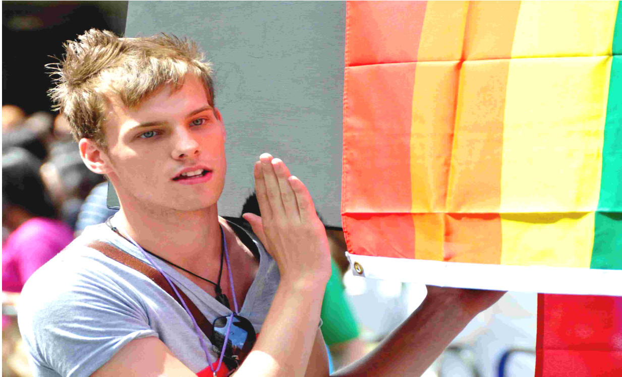
juna viro dum geja fiero en Londono