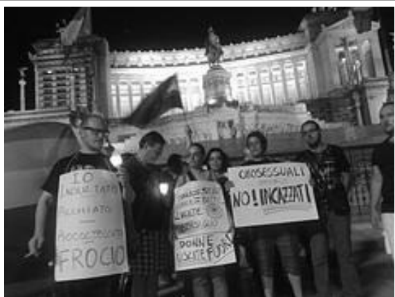
La torĉo-marŝo en Romo, 4 septembro 2009, ĉi tie antaŭ la monumento Vittoriale aŭ Patruja Altaro.

parlamento la 13an de oktobro, sed malaprobiĝis, kio rezultiĝis en granda skandalo sur ĉiuj amaskomunikiloj, ĝis eĉ akuzo flanke de Navi Pillay, Alta Komisiito de UN pri homaj rajtoj.