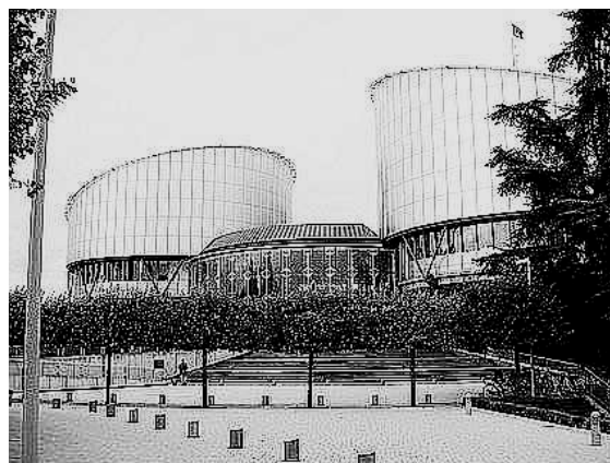
Eŭropa Juĝa Kortumo Por Homaj Rajtoj

La fratinoj montris sin ŝokitaj post la juĝo. "Ni ne komprenas, kial ni devas tion travivi dum niaj jam maljunaj tagoj", ili deklaras per komuna proklamo. "Nia sola krimo estas, ke ni ne estas edzinoj, ĉar ni vartis niajn gapatrojn kaj du onklojn ĝis ties mortoj.