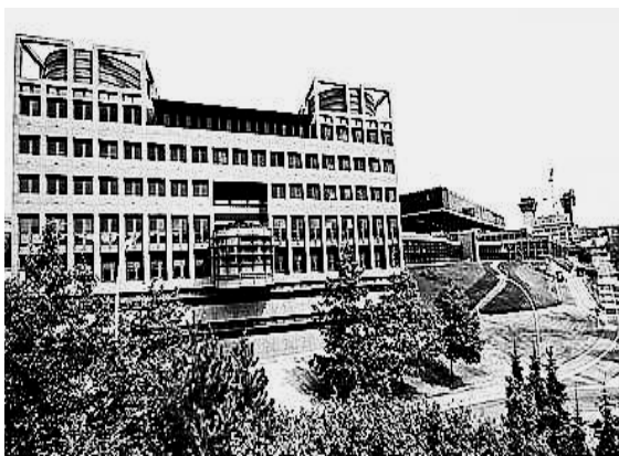
Eŭropa Juĝa kortumo en Luksemburgo

Kiam tiu mortis kvar jarojn poste, la prizorga instituto de la germanaj scenejoj (Vddb) rifuzis al li la elpagon de pensio por postlasitoj. Malleĝe, kiel la Eŭropa Juĝa Kortumo (EJK) konstatis, kiun la Bavaria Juĝejo Administracia alvokis por fine klarigi la aferon.