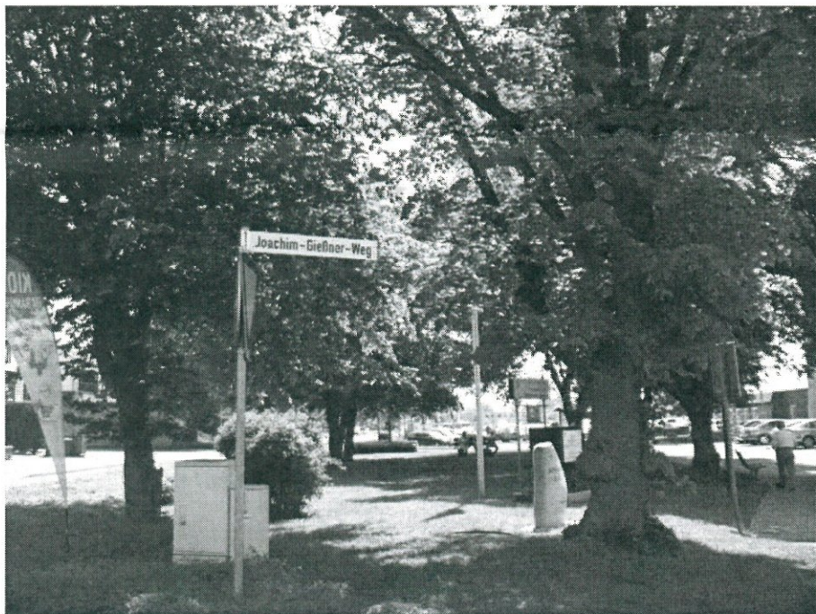
Der Joachim-Gießner-Weg in Herzberg