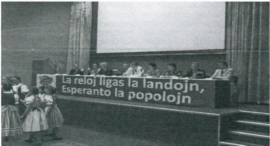
IFK Liberec: Inaŭguro