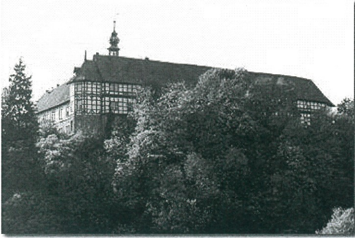
Welfenschloss in Herzberg