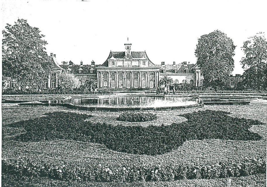
Dresden-Pillnitz – Neues Palais