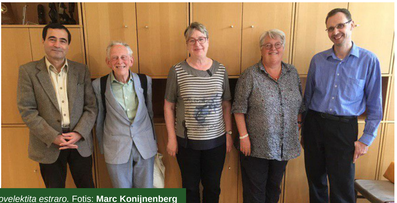
La novelektita estraro.

Post tiuj punktoj venis grava afero. Elekto de novaj estraranoj. La sekretario Pieter ne finis sian deĵorperiodon ĝis la jarkunveno; jam en la printempo li foriris. Feliĉe ni havas la sistemon ke funkciuloj havas retadreson de la asocio. Mi anoncis al la plufunkciantaj estraranoj, kiuj ne sciis kien sin turni, ke mi pretas provizore transpreni tiun retadreson. Post funda pripensado mi decidis kandidatiĝi min kiel sekretario. Por du jaroj maksimume. Dum tiuj du jaroj mi esperas ke iu alia kandidatiĝos kiel sekretario.