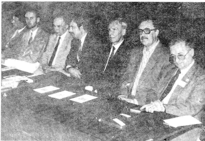
La prezidio dum la inaŭguro de la kongreso

Dum la kongreso okazis ĝeneralaj kunsidoj de SAT, kunsidis 5 SAT-frakcioj (pacista, na-