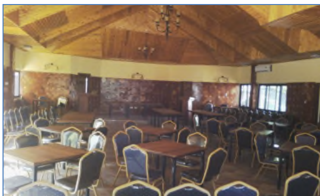
Restoracio de la kongresejo