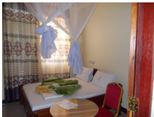
Tipa ĉambro en la kongresejo