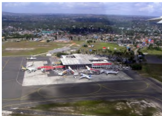
La internacia flughaveno en Dar-es-Salaam

Ĉi tiu komuniko estas disponebla laŭ la permesilo Krea Komunaĵo Atribuite Samkondiĉe 4.0 Tutmonde. Por pli da informoj vidu ĉe: https://creativecommons.org/licenses/by-sa/4.0/ .