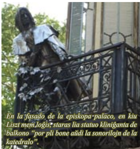
En la fasado de la episkopa palaco, en kiu Liszt mem loĝis, staras lia statuo kliniĝanta de balkono “por pli bone aŭdi la sonorilojn de la katedralo”.