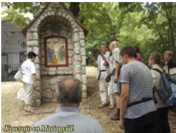
Krucvojo en Mariagyűd.

de la pilgrimloko ĉiam signifas, ke Maria kondukas nin pli proksimen al Jesuo. En la vivo de kredanto devas vidiĝi, ke ni estis ĉe Maria kaj ke Maria kondukas nin pli proksimen al Jesuo, kaj ĉio tio laŭ aŭtentika maniero. Kiel malan ekzemplon p. Kóbor menciis unu sian samvilaĝanon, kiu “fieris” pri plurfojaj vizitoj al Maria la pilgrimloko, sed hejme li kverelis kun sia frato kaj blasfemis: “ĉu vere tiu homo ŝanĝiĝis? Ĉu li pli aproksimiĝis al Jesuo?”.