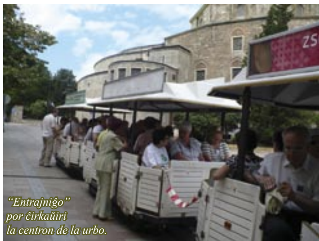
“Entrajniĝo” por ĉirkaŭiri la centron de la urbo.

preleganto krome menciis la celojn de la Papo: li pritraktas ja science la vivon de Jesuo kaj ne forgesas menciigi kaj kritiki la tiel nomatan historie-kritikan ekzegezon, kun la celo sanigi kaj superi la disiĝon inter la moderna kaj la tradicia eklezia ekzegezo. Benedikto 16a enkondukas al la personeco de Jesuo komparante lin kun Moseo, kaj sekve detale pritraktante la rilaton inter Izraelo kaj la Eklezio kaj la gravecon de la Malnova Testamento por la