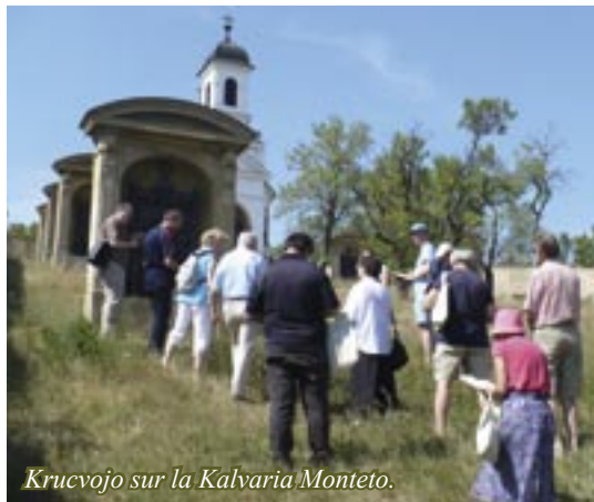
Krucvojo sur la Kalvaria Monteto.

La preleganto ankaŭ atentigis, ke la kredo estas donaco. Dio vekas ĝin en ni, sed ne sen ni. La kredo estas homa respondo al la revelacio de Dio. Ni ekkonas, ke Dio tuŝis nin. Fronte al tio, kion Li jam pretigis kaj donis al ni, estas nia tasko respondi. Nur tian rolon ni ludas en la travivo de la kredo, sed tion ni devas fari.