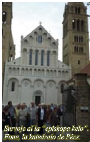
Survoje al la “episkopa kelo”. Fone, la katedralo de Pés.