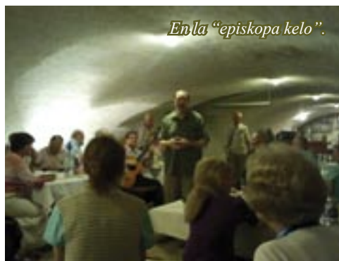
En la “episkopa kelo”.

La vespera programo disvolviĝis en la episkopa kelo, kie post la vespermanĝo sekvis gaja vespero kun kantado kaj loterio favore al la kongresa kaso.