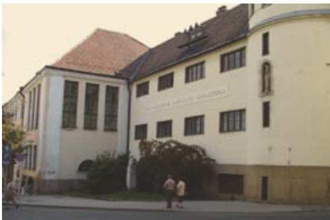
Pécs: cisterciana gimnazio kaj kolegio, nia kongresejo.