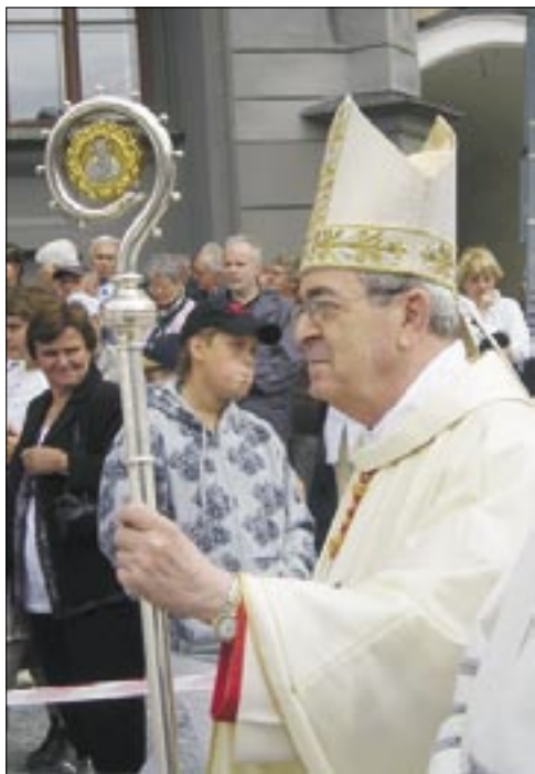
Kardinalo Rigali el Filadelfio en Prachatice

Sed nun ni rigardu ankoraŭ je pluaj interesaj eventoj, kiuj ligas sin al nia