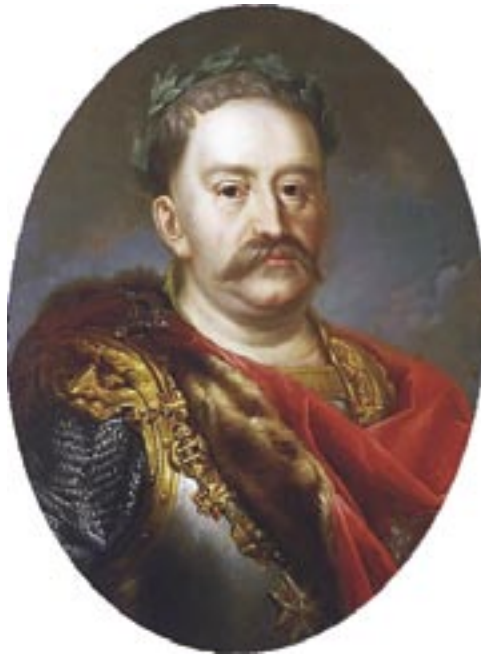
Pola reĝo Jahano Sobieski

tero, precipe dum la lasta Dua Mondmilito, kiam kune kun polaj soldatoj ili sinofere kontraŭstaris nazihitleran invadon kaj forŝovante la komunan malamikon okcidenten forpereiis ses mil gejunuloj. La sango devas ligi rusojn kaj polojn kaj reciprokigi ilin per la amikeco kaj amo. El la historio oni menciuj la fakton, ke la Nigra Madono el Ĉenstoĥovo iris al Polujo ĝuste tra Ruslando. Tie ankaŭ laboris polaj martiroj, sankta Jozefato Kuncewicz, mortigita en Janovo (1657). Ĉio ĉi igas polojn esperi, ke la du najbaraj nacioj vivos pace kaj amikece. En Ukrainio kaj en Litovio poloj havas karajn memoraĵojn – en Lvovo kaj en Vilno. En la lasta famas la Akra Pordego „Ostra Brama“ kun la gracodona Maria-bildo pentrita en Krakovo kaj la tombo