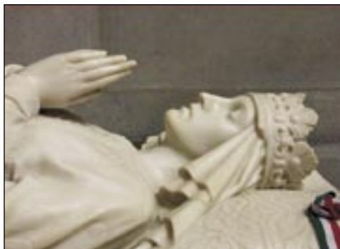
Tomba monumento de la reĝino s-ta Hedviga en la katedralo de Wawel, Krakovo, Polujo

(+1292) kaj Hedviga (+1399). Ambaŭ reliefis polan religiemon, kion poloj reciprokas per vera amo. Sufiĉas viziti klostron en Stary Sącz, kie kuŝas restaĵoj de Kinga kaj kastelon Wawel en Krakovo, kie estas tombo de Hedviga, por konvinkiĝi pri la dankemo de gepoloj. Ankaŭ klostro sur la Hela Monto en Częstochowa ofte gastigas hungarojn, kiuj volonte tien pilgrimas.