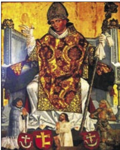
Kardinalo sankta Stanisław Kostka

Sufiĉe vastaj rilatoj ligas polojn kun Francio. En la 18-a jarcento poloj donis al Francujo reĝinon Maria-Karolina, edzinon por Ludoviko la 15-a kaj reciproke la francoj akceptis gaste polan forpelitan reĝon Stanislavon Leszczyński, kiu mortis kiel princo de Lotaringio (1736) kaj ripozas en Bonsecours ĉe Nancy. Dum la pola pli ol 120 jarojn daŭranta dispartigo poloj kune kun francoj batalis malfeliĉe sub imperiestro Napoleono Bonaparte, esperante je renaskiĝo de Polujo. Post la malvenko multaj polaj elmigrintoj trovis rifuĝejon en Francio, same kiel post la unua kaj dua mondmilitoj.