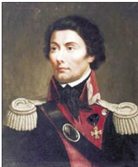
Generalo Tadeusz Kosciuszko

Finfine, preskaŭ ne ekzistas lando sur la tero, kie ne vivus poloj, ne batalus por la libereco kaj ne konstruadus la novan vivon. Diversaj historiaj eventoj dispelis la polan nacion en la vastan mondon. Estas la diraĵo, “Kien ajn oni paŝas, ĉie oni surtretas la polajn piedŝojn”.