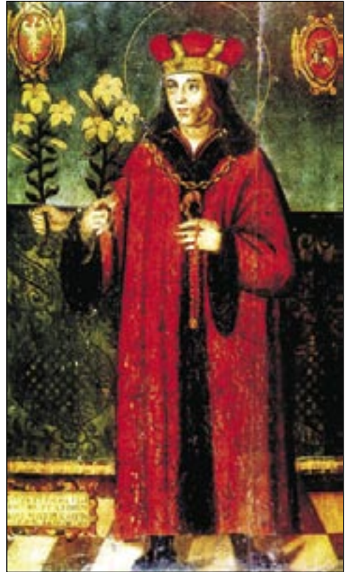
Reĝido sankta Kazimiro, Krakovo, Polujo

Kun Ruslando ligis polojn ankaŭ baltkampoj. Tutan Siberion kovras multaj ostoj de polaj naciaj herooj, sed ankaŭ en Pollando ne mankas tomboj de rusaj soldatoj mortigitaj dum bataloj sur la pola