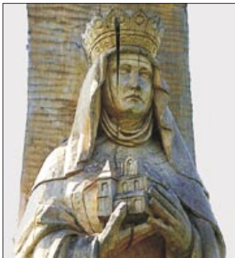
La reĝino sankta Kinga en Wislica, Polujo

Al Hungario poloj estas dankemaj por du sanktaj reĝinoj, nome pro Kinga