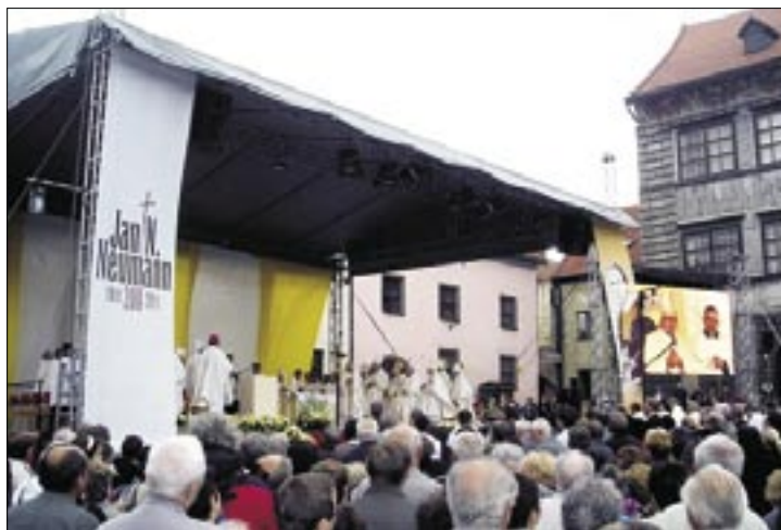
Soleno de ducentjara datreveno de la naskiĝo de sankta Johano Nepomuk Neumann en Prachatice la 18-an de junio 2011

post morto de iliaj gepatroj la citita kongregacio por konstitui tie urban hospitalon. Tradicio de sanzorga establaĵo restis sur tiu loko ĝis nuna tempo. La origina domo estis poste alikonstruita, en la naskiĝĉambro de nia sanktulo instalas fratulinon kapelon. Malgranda malsanulejo estis vastigita je najbaraj domoj kaj modernigita, de la jaro 2005 funkcias tie ordena hospico portanta nomon de sankta Johano Nepomuk Neumann, ununura tiu establaĵo en suda Bohemio.