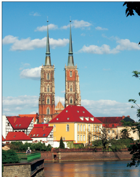
Katedralo de sankta Johano la Baptisto

De la 18-a ĝis la 25-a de julio okazis en belega loko de la pola urbo Vroclavo la 19-a Ekumena E-Kongreso (62-a de IKUE kaj 59-a de KELI). Ke la kongreso estis agrabla kaj tre sukcesa aranĝo, tion certe asertas pli ol ducent ĝiaj partoprenintoj el 19 landoj.