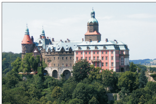
Kastelo Książ, la plej granda en Malsupra Silezio

“Ami kaj agi fidante – Albert Schweitzer kaj Patrino Tereza”.