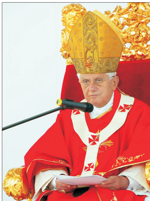
Homilio de la Papo en sankta meso celebrata en solenaĵo de la martiro sankta Venceslao en Stará Boleslav

Hodiaŭ matene ĉe la altaro nin unuigas glora rememoro pri la martiro sankta Venceslao, al kies relikvoj mi antaŭ la sankta meso omaĝis en la baziliko al li konsekrita. Per sia sango li aspergis vian teron. Lia aglino, kiun vi elektis kiel emblemon de mia vizito ĉi tie – antaŭ momento tion memorigis via kardinalo ĉefepiskopo – estas historia simbolo de la sublima ĉeĥa nacio. Tiu granda sanktulo, kiun vi volonte nomas “eterna” princo de la ĉeĥoj, nin invitas, por persiste kaj fidele sekvi Kriston, instigas nin, ke ni estu sanktaj. Li mem estas modelo de sankteco por ĉiuj, precipe por tiuj, kiuj direktas la sortojn de la socio kaj de la nacio. Sed ni demandas: ĉu la sankteco