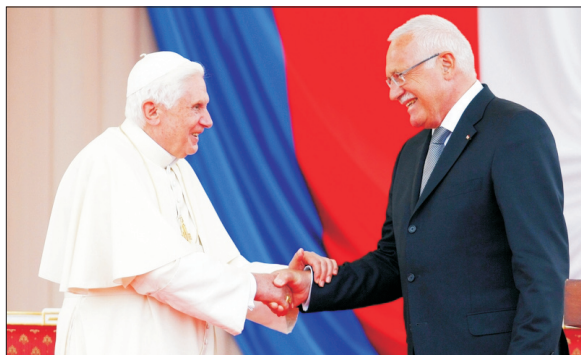
Adiaŭo de la Papo kun ŝtatprezidento Václav Klaus

ĉiujn homojn, malriĉulojn eĉ riĉulojn li amis”. Laŭ la Sinjoro li lernis esti “kompatema kaj favorkora” ( Resp. psalmo ) kaj plenigita per la spirito de evangelio li kapablis eĉ pardoni al sia frato, kiu klopodis ĉesigi lian vivon. Tial vi prave lin nomas “heredanto” de via nacio kaj, en al vi bone konata kanto, vi lin petas, ne