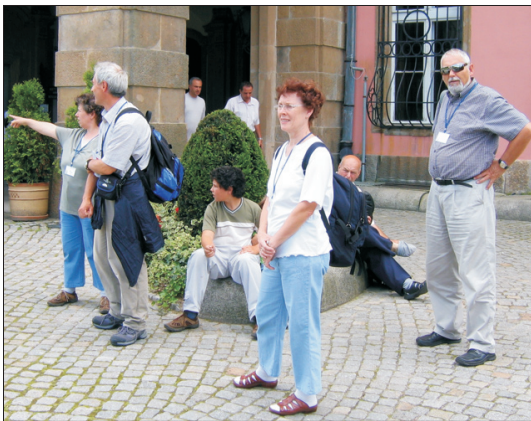
Surkorte de la kastelo Książ

Sekvis vizito al kastelo Książ, la plej granda en Malsupra Silezio kaj tria laŭ grandeco en Pollando. Kaj lasta estis la vizito al kuracloko Szczawno Zdrój. Alveturinte al la urbo estis videbla granda surskribo, per kiu la urbo bonvenigis la kongresanojn. Krom ĝuo de la urbaj vidindaĵoj okazis tie honore al la kongresanoj koncerto. En la urba parko oni ankaŭ vizitis ŝtonon kun memortabulo, kies surskribo informas, ke en 1902 loĝis en Szczawno Zdrój kiel kuracgasto D-ro Ludoviko Zamenhof, kreinto de