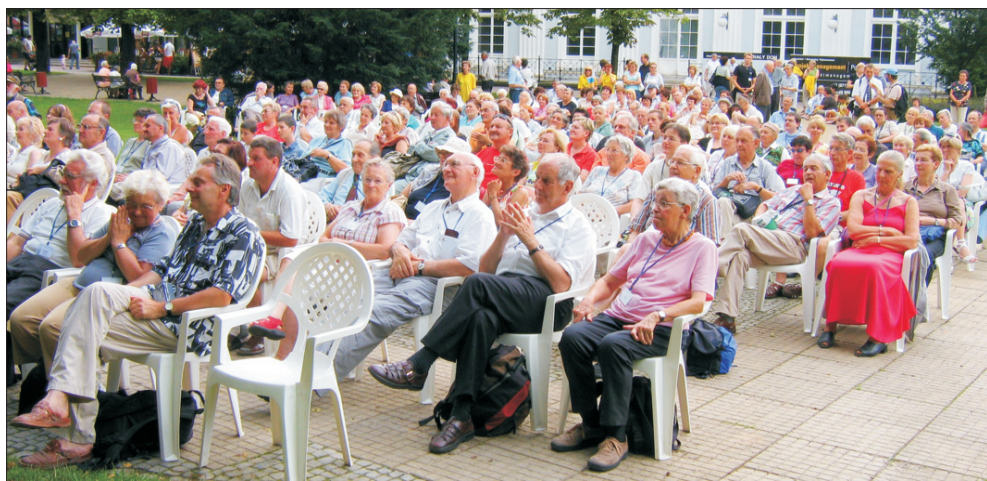
Dumekskursa merkreda koncerto en kuracloko Szczawno Zdrój