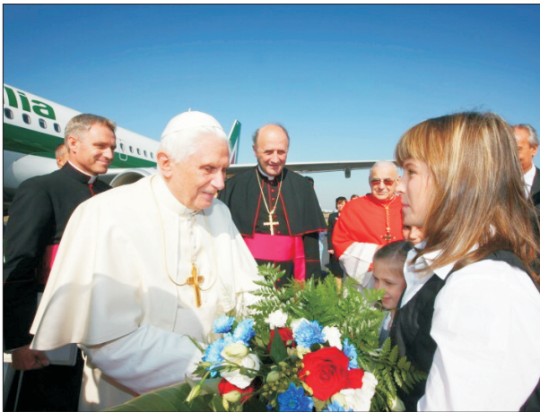
Bonvenigo de la Papo post lia alveno

disĉiploj “mallarĝan” vojon al sankteco: “Kiu perdos sian vivon pro mi, tiu trovos ĝin” ( kp. Mat 16,25 ). Kaj hodiaŭ matene Li klare ripetas: “Se iu volas veni post mi, li abnegaciu sin, levu sian krucon kaj sekvu min.” ( Mat 16,24 ). Certe, ĝi estas malmola parolo, malfacile akceptebla kaj realigebla. Sed la atestado de la sanktuloj kaj sanktulinoj al ni pravas, ke tio estas ebla, se la homo sin konfidigas al Kristo kaj fidigas al Li. La ekzemplo de la sanktuloj kuraĝigas ĉiun, kiu sin nomas kristano, por esti fidinda, do vivi laŭ principoj de la kredo, kiun li konfesas. Vere ne sufiĉas nur ŝajni sin bona kaj honesta homo; estas necese efektive tia esti. Kaj bona kaj honesta estas tiu, kiu ne kovras per si mem la lumon de Dio, ne altigas sin, sed li lasas pere de si tralumi Dion.