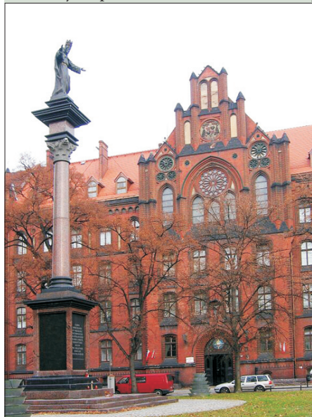
Alta porpastra seminario – la kongresejo

Por plenaj detaloj, aliĝilo kaj kotizoj: http://www.ikue.org/kong2010/index.htm