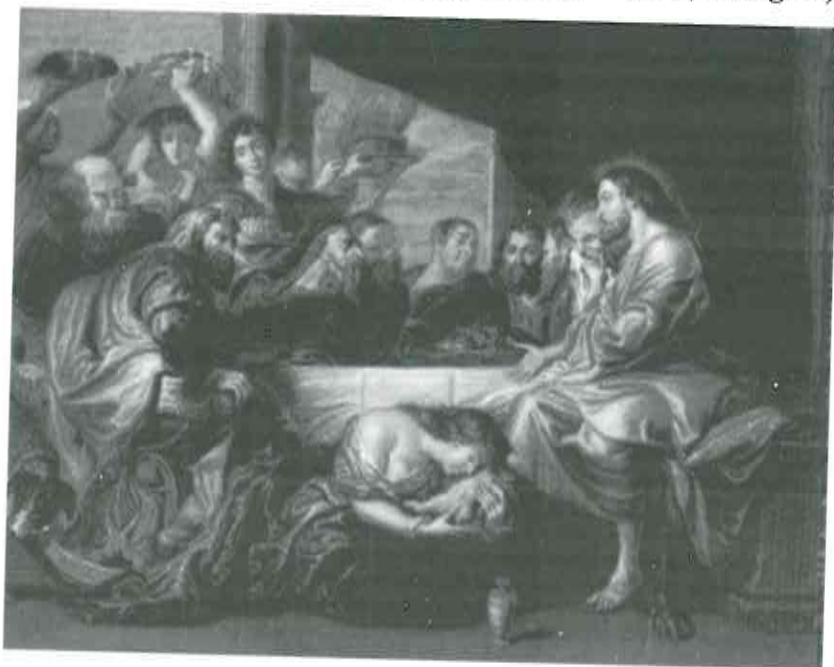
Maria Magdalena lavas la piedojn de Kristo, pentraĵo de Pieter Paul Rubens (Getty Museum)