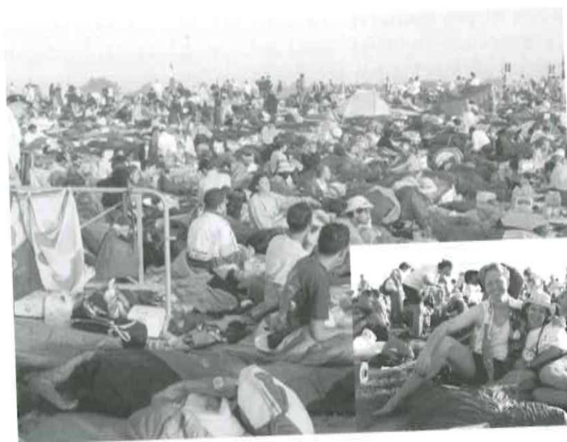
Vekiĝo post la subĉiela tranokto

branĉoj suriris la podiumon, dum aliaj 4 alportis ŝtonon