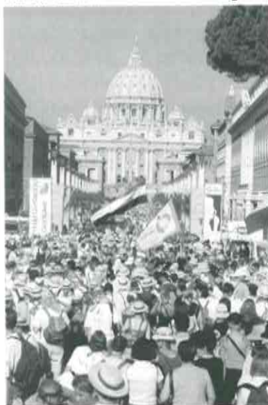
Dum horoj, seninterrompa enviciĝo da pilgrimantoj iras al la Sankta Pordo

Laŭ la hodiaŭa komuniko de la gazetara salono de la Sankta Seĝo, la Papo esprimis «sian plenan ĝojon por la etoso de festo kaj pro la entuziasmo» per kiu la pli ol 700.000