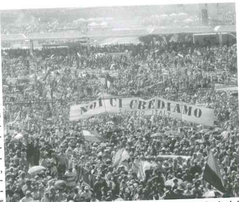
"Ni kredas je tio"

fariĝinte plenkreskuloj, daŭre vivas en la kredo tie, kie ili loĝas kaj laboras. Vi alportos la anoncon de Kristo en la novan jarmilon. Revenante hejmen, ne disigŭ. Konfirmu kaj pli-