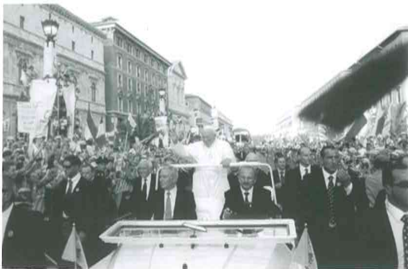
Trairinte la urbon meze de seninterrompa viciĝo de gejunuloj, la Papo atingas Placon Sanktan Petron, por daŭrigi la inaŭguron de la JMT, post la unua parto ĉe la Baziliko de Sankta Johano laterana

la Papo kaj la gejunuloj ekde Placo Sankta Johano Laterana ĝis Placo Sankta Petro. La Papon akceptis la nerezistebla entuziasmo de la preskaŭ 700.000 geknaboj el 160 landoj, kiuj svarmis en la du romaj placoj. «Ho Romo vi estas feliĉa, ĉar Vi estas konsekrita de la atesto kaj de la sango de la apostoloj Petro kaj Paŭlo, kiuj ankoraŭ hodiaŭ kiel lumantaj lampoj indikas al ni Tiun, kiun ni ĉi tie volas