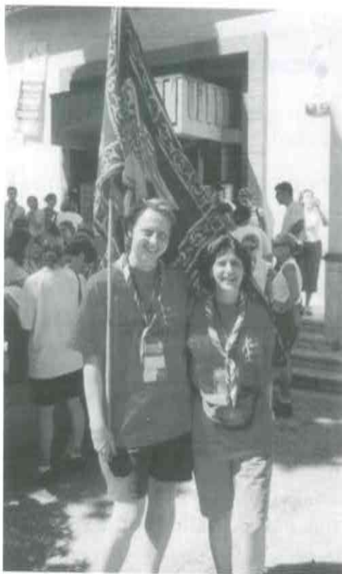
Kun la venecia flago en Romo

La lastan vesperon, la familioj atendis la knabojn en la loko kie haltas ilia aŭtobuso. Atendante, ni rakontis pri nia mallonga sperto. Preskaŭ ĉiuj havis problemojn pro la lingvo, kvankam la volontuloj estis tre precizaj ankaŭ pri tio: kiam mi akceptis gastigi la pilgrimantojn, oni petis al mi kiujn lingvojn mi konas. Kaj, surprizon!, unu el la knabinoj indikitaj al mi parolis ĝuste la francan, kiun mi konas! Sed mia amiko havis problemojn, ĉar unu el la knabinoj ĉe li, post la alveno, fartis malbone, kaj matene ŝi ne povis