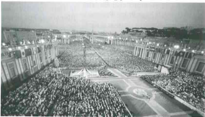
Placo Sankta Petro kaj la fronta aleo svarmis je gejunuloj

malfermi siajn korojn al Kristo, ripetante la inviton kiun li faris komence de sia papado: «Ne timu! Malfermu, eĉ malfermegu la pordojn al Kristo! Malfermu viajn korojn, viajn vivojn, viajn dubojn, viajn malfacilaĵojn, viajn suferojn kaj viajn ĝojojn kaj amemojn: malfermu ĉion tion al lia savodona forto kaj lasu, ke li eniru en viajn korojn!».