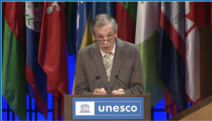
General Conference – 42 nd session Conférence générale – 42 ème session

109-A UNIVERSALA KONGRESO DE ESPERANTO ARUSHO, TANZANIO, 3-10 AŬGUSTO 2024