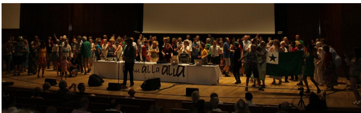
Danci kun jOmO!