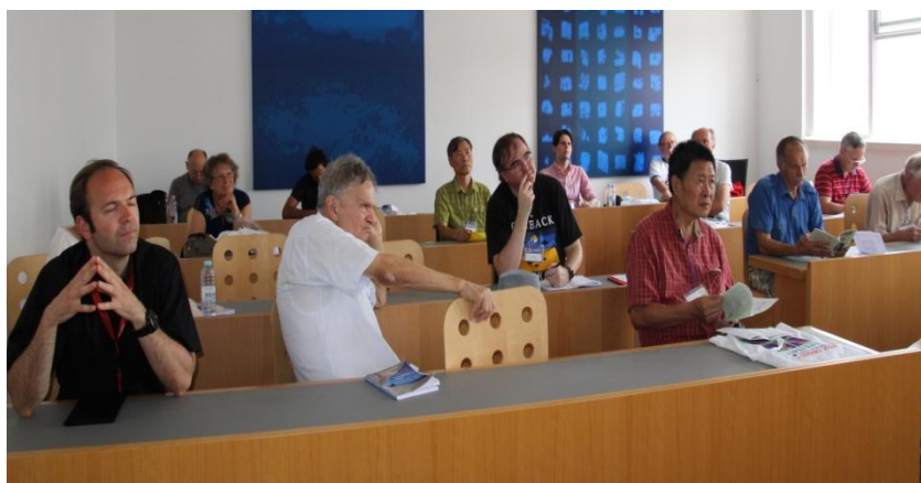
Parto de la publiko dum la prelegoj