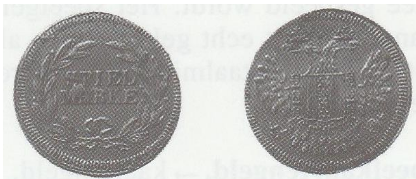
Nurenberga ludmarko (Spielmarke) el latuno, el la 19a jarcento.

Krome, ĵetonoj estis eldonataj kun multvariaj aspektoj por satirstile rememori ekzemple fiaskajn batalojn de iu ajn nobelo, aŭ ekzemple okaze de la pereado de la hispana armada (militfloto) kaj aliaj mokindaj eventoj. Rare ili havis pozitivan mesaĝon, probable por lakei iun potenculon. En la lasta fazo de ilia historio ili estis uzataj nur kiel ludĵetonoj por celoj en kaj ekster la domo. Tiaj ĵetonoj – kun pli moderna aspekto – eĉ nuntempe ankoraŭ havas funkcion.