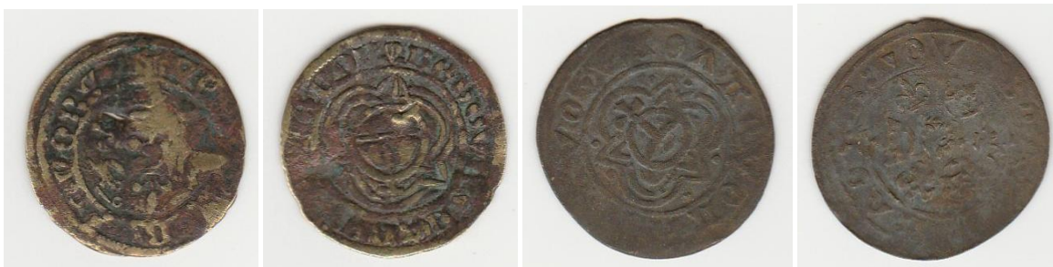
Numbergaj kalkulĵetonoj el la 16a kaj 17a jarcentoj, elfositaj kaj klare eluziĝintaj, trovitaj en la ĉirkaŭaĵo de Veurne (Belgio).

Kiam mankis oficialaj moneroj, oni rajtis pagi per tiaj ĵetonoj. Ke multaj el ili regule estis uzataj kiel pagilo, pravas la eluziĝo de multaj elfositaj ekzempleroj. La nura uzo sur abako ne povas klarigi tian eluziĝon!