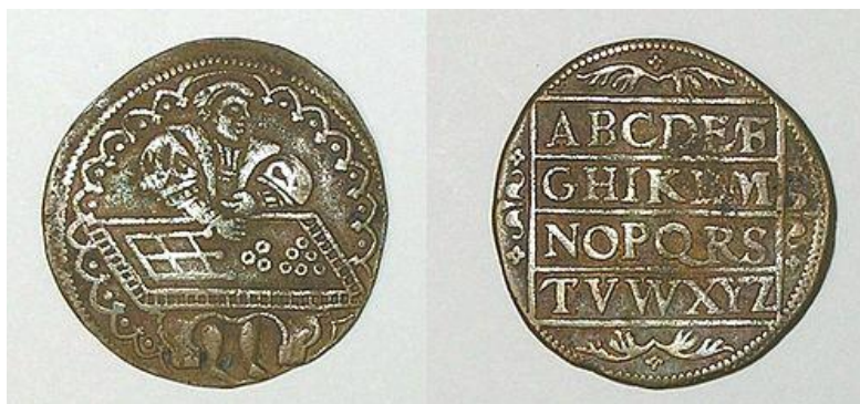
Nurenberga kalkulĵetono el 1553 kun bildo de abako

Per tiel nomataj kalkulĵetonoj, metitaj sur abakon (horizontala kalkultabulo aŭ -tuko), oni kalkulis en Eŭropo dum pli ol kvin jarcentoj. En la franca oni uzis por ĝi la terminon jeton (<gectoir / getone / gectoni). Tamen, kiel la angla token , ĝi havas diversajn signifojn, i.a. gildĵetono, ludmarko aŭ enirĵetono. En grandaj magazenoj oni ankaŭ uzis jetons , kiam apunto malabundis.