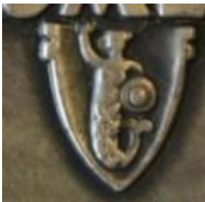
Urba blazono de Varsovio

Meze: surskribo antaŭ ornama fono “OMAGE AL ZAMENHOF EN LA CENTJARA DATREVENO DE LA NASKIGO VARSOVIO MCMLIX”