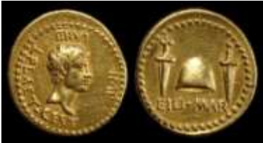
Posedas la Deutsche Bundesbank

La truita ekzemplero antaŭ nelonge en aŭkcio estis vendita kontraŭ preskaŭ tri milionoj da eŭroj. Ĝi do estas la plej multekosta kaj rara romia monero en la mondo.