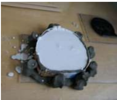
Verŝi la gipsajn supraĵojn