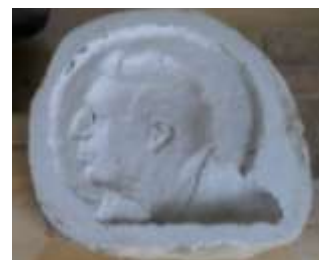
La efiko de lumo kaj ombro

La gipsaj supraĵoj estas “negativaj”, sed ili aspektas kvazaŭ la portreto estus reliefa; jen aldona efiko de la lukto inter lumo kaj ombro. Kiam la supraĵoj estas tute sekigitaj, argilo estas premata inter la supraĵojn kaj tiel ekestas argila medalo. Ĝi estas prilaborata dum la sekiga proceso ĝis la medalistino kontentiĝas. Kiam la argila medalo estas tute seka, ĝi estas bakata en ceramikforno. Tiel aperas terakota modelo. Ĝi estas la fina, t.n. patrino modelo, kiu estas multe malpli delikata ol la nebakita argilmodelo.