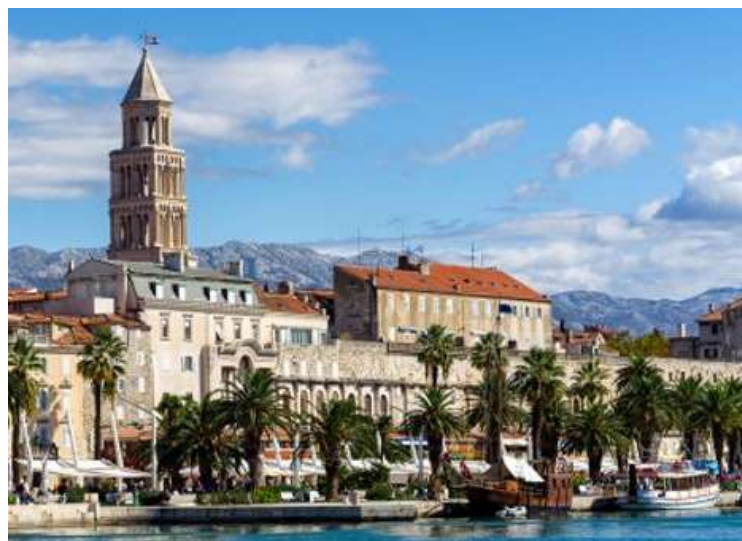
La ĉirkaŭaĵo de la katedralo de Split