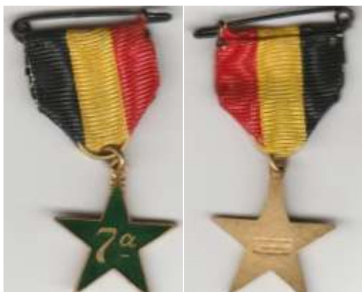
UK Antverpeno 1911 Vidu ankaŭ: jk.8 n-ro 4

por la jubilea jaro 1912 la sama firmao do kreis almenaŭ du diversajn medalojn, post la eldono de memoriga medalo por la Universala Kongreso en Antverpeno en la jaro 1911.