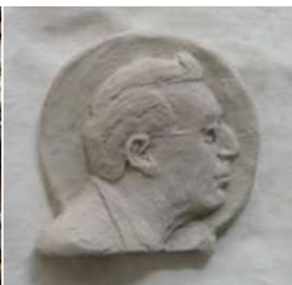
La terakota modelo