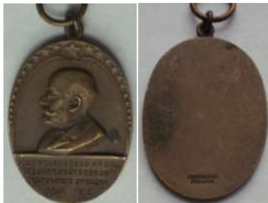
25a jubileo de Esperanto 1887 - 1912 jk.5 n-ro 3