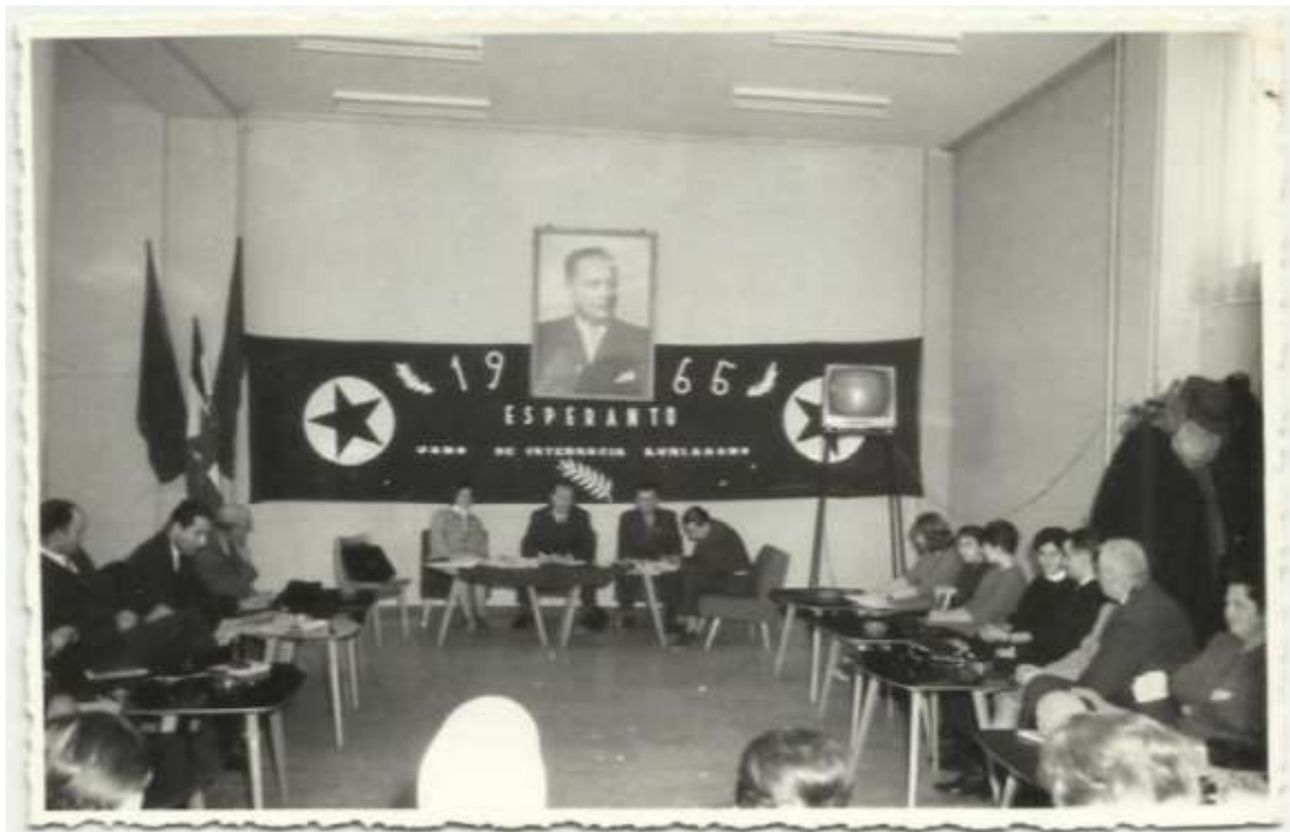
“Jaro de internacia kunlaboro” en 1965. Kunveno de jugoslavaj esperantistoj.