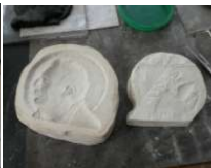
La gipsaj supraĵoj estas pretaj

La gipsaj supraĵoj estas “negativaj”, sed ili aspektas kvazaŭ la portreto estus reliefa; jen aldona efiko de la lukto inter lumo kaj ombro. Kiam la supraĵoj estas tute sekigitaj, argilo estas premata inter la supraĵojn kaj tiel ekestas argila medalo. Ĝi estas prilaborata dum la sekiga proceso ĝis la medalistino kontentiĝas. Kiam la argila medalo estas tute seka, ĝi estas bakata en ceramikforno. Tiel aperas terakota modelo. Ĝi estas la fina, t.n. patrino modelo, kiu estas multe malpli delikata ol la nebakita argilmodelo.