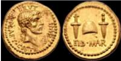
Posedo de la The British Museum