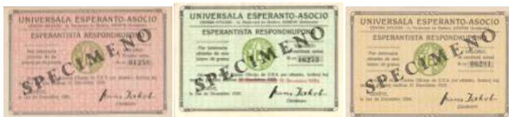
Ilustraĵoj aldonitaj de la ENA-redakcio