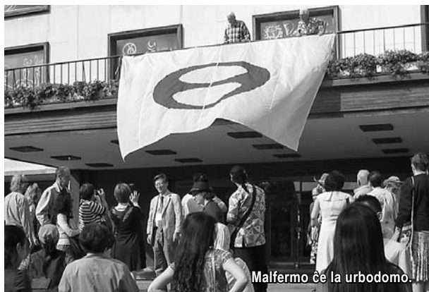
Malfermo ĉe la urbodomo.

La ĉefan simpozian prelegon faris la belga kirurgo d-ro Réginald Moreels . Li iam estis ministro, iam senatano en Belgio, kaj aktivis en la internacia, neŭtrala medicina helporgano Kuracistoj sen limo. Tiu organizo aktivas en 88 landoj kaj helpas dum militaj konfliktoj kaj post naturkatastrofoj. Li havis kiel la temon de la prelego Ĉu milito povas esti justa? Mi komprenis, ke li diris ne, sed iam jes kaj ĉiukaze la problemo es-