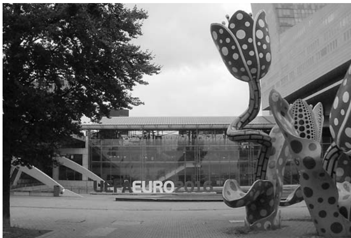
Reklamo por la venontjara piedpilka ĉampioneco (R)

Dum la Aŭkcio plej multe elspeziĝis por letero de Zamenhof (1100 €), dum la kongresnumero 1 estis havebla malmultekoste por nur dekono de ĝi.