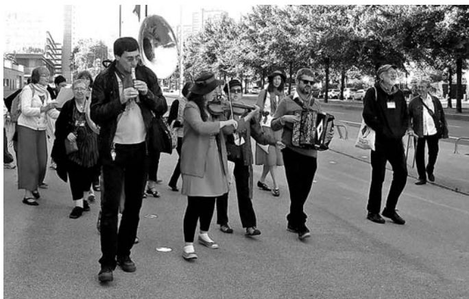
Muzika procesio tra la urbo (K)