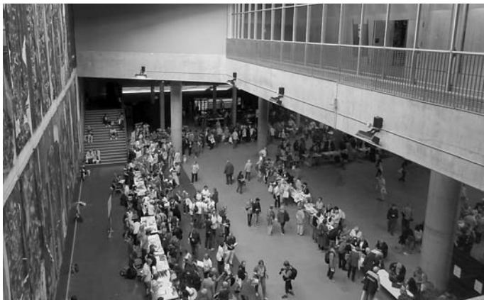
Rigardo sur la Movadan Foiiron en salono Michaux, ĉefa halo kun scenejo, kafejo kaj rendevua tabulo (M)