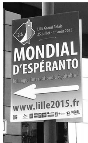
Afiŝo por la UK (R)

Antaŭ dek jaroj okazis renkontiĝo en Bulonjo-ĉe-Maró por memori la centjariĝon de Universaliaj Kongresoj. Tiam starigis busto de L.L. Zamenhof ĉe stacidomo de la urbo. Nun instaligis aldona tabulo, kaj la urbo dediĉis ejon por iĝi Esperanto-centro.