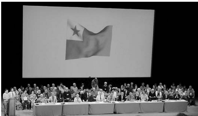
La Malfermo de la UK (K)