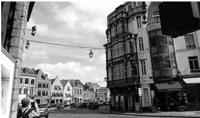
En la malnova urbo de Lillo (K)