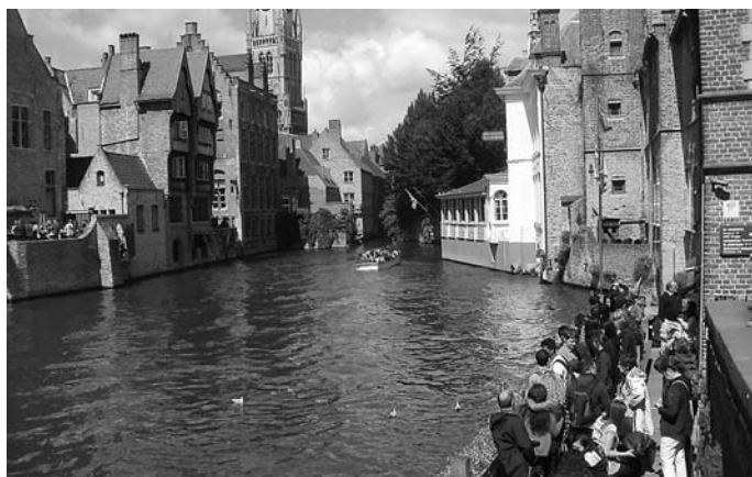
Veturo tra kanaloj dum ekskurso al la belga Brugge (Bruĝo) (R)