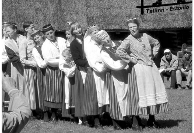
Folkloro danco en la liberaera muzeo

BET okazas vice en Litovio, Latvio kaj Estonio, kaj nun estis la vico de Estonio, kie kunvenis 75 geesperantistoj el 9 landoj. Liston pri la landoj kaj homoj ni ne ricevis, sed kompreneble la plejparto de la partoprenantoj venis el baltaj landoj, ankaŭ el Pollando, Italio, Francio, Svedio kaj Finnlando venis kelkaj homoj. La programo konsistis ĉefe el prelegoj, sed ĉiun tagon finis "Amuza vespero" inter la 19-a kaj 21-a horoj: dancado, muziko, interbabilado. La BET-ejo estis renovigita internulejo SISEKAITSEAKADEEMIA por fajrobrigadistoj, policistoj, limgardistoj kaj aliaj.