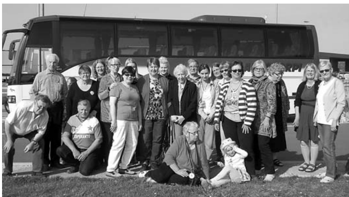
Grupfoto de la karavanaj partoprenantoj (M)