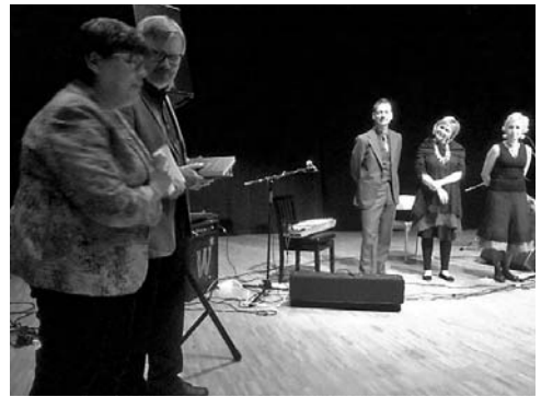
Danko por Suunta