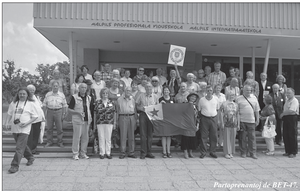
Partoprenantoj de BET-47.

Partoprenantoj de BET-47 loĝis en la malmultekosta studenta hotelo de la lernejo aŭ en hotelo “Mālpils muiža”, ankaŭ nomita palaco de Malpils. La bieno Malpils estis konstruita en 1760, sed renovigita post la bruligo en 1905. Hodiaŭ la konstruaĵo estas tre bele renovigita altkvalita hotelo. Ni faris ankaŭ ekskurson al palaco kadre de la kongreso kaj aŭskultis legendojn pri baronoj kaj baroninoj kaj pri iliaj