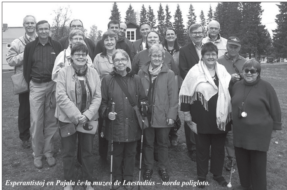
Esperantistoj en Pajala ĉe la muzeo de Laestadius – norda poligloto.