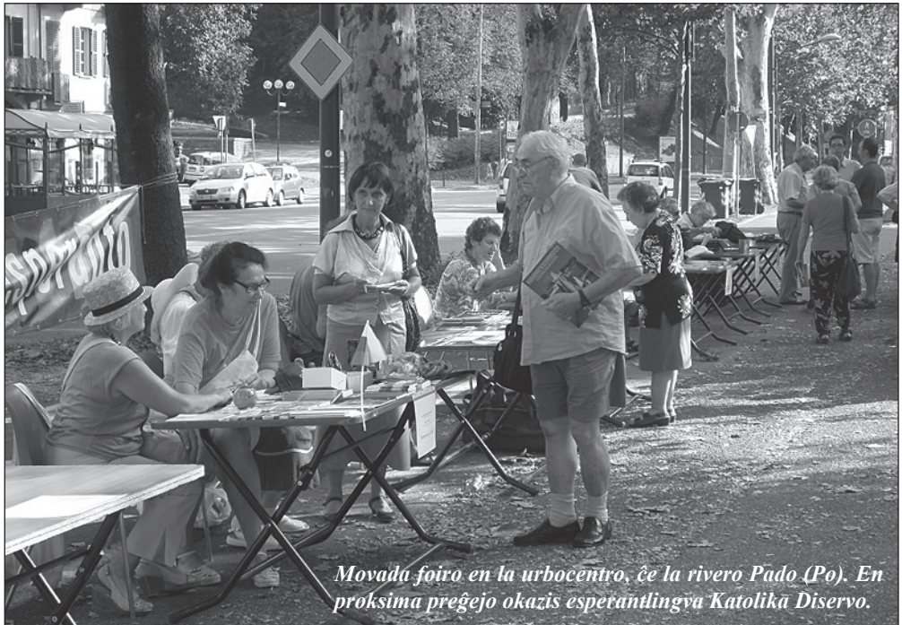
Movada foiro en la urbocentro, ĉe la rivero Pado (Po). En proksima preĝejo okazis esperantlingva Katolika Diservo.