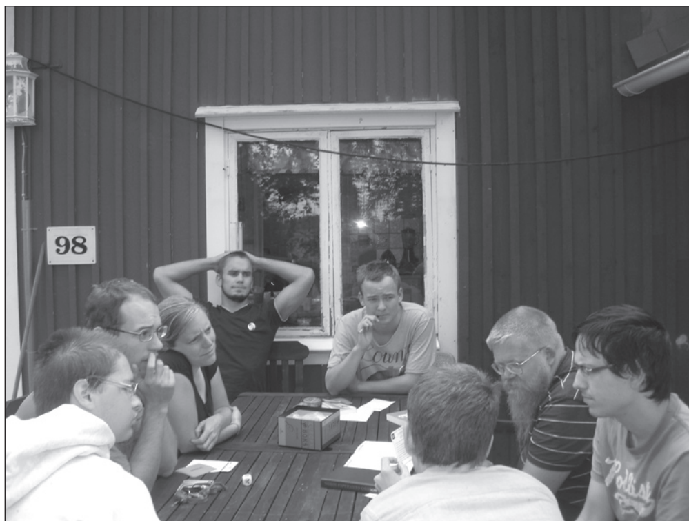
Junularo kvizas dum la tendaro.