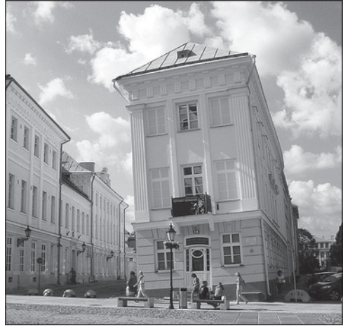
La fama kliniganta domo ĉe la urbocentra placo en Tartu.