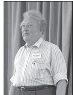
(Fotita dum BET 39)