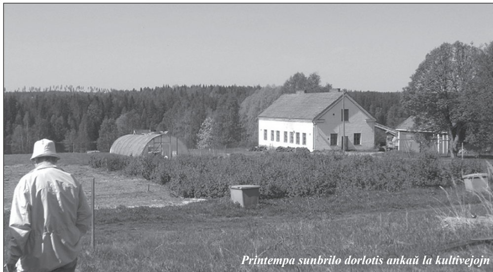
Printempa sunbrilo dorlotis ankaŭ la kultivejojn