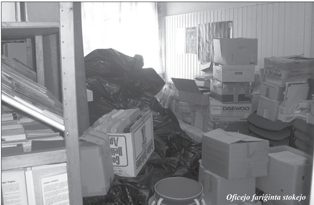
Oficejo fariĝinta stokejo

Nun komenciĝis nova operacio. Post la ofi- ▷