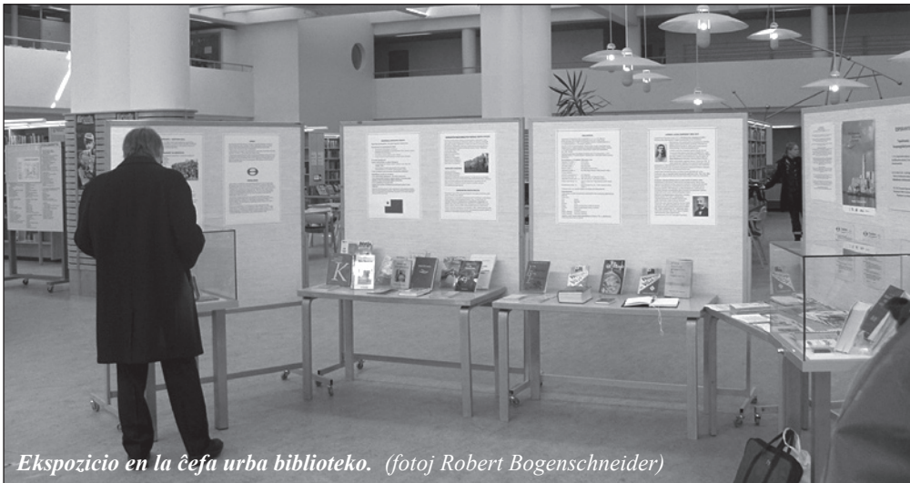
Ekspozicio en la ĉefa urba biblioteko.

La kunveno komenciĝis per kantoj. Laŭ programo tio nomiĝis muzika interludo. Kantis en akompano de propra gitarludo du studentinoj.