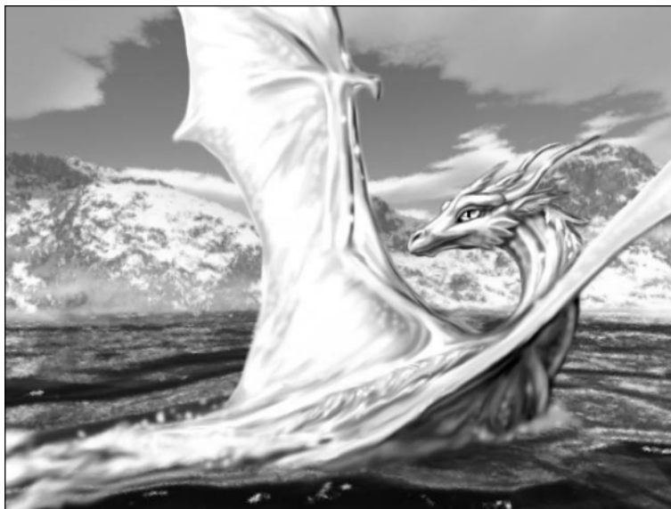
Bildoj (c) www.dreslough.com