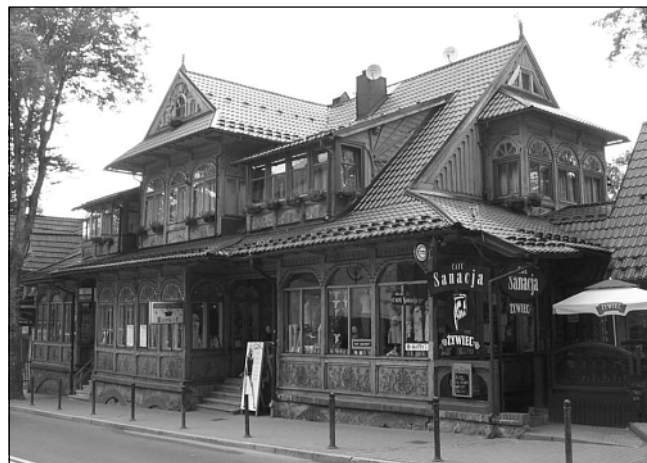
Unu el multaj folkloraj domoj de Zakopane.

Pliajn informojn vidu en la ttt-ejo http://www.tejo.org/ijk , kaj atentu aliĝi antaŭ la 1-a de majo (malrabato por aliĝi malpli frue).