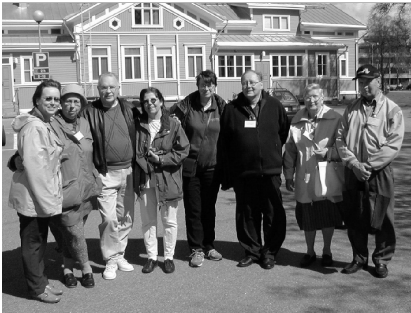
Gastoj kaj gastigantoj sur la korto de la urbodomo en Salo la 22an de majo.