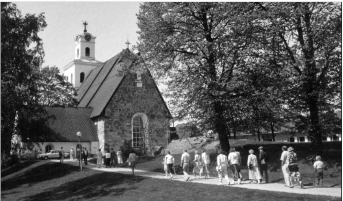
(dum la turkua-tamperea ekskurso al Raŭmo la 28an de majo 1992).

Laatua viestintään -projekti avataan virallisesti. Sen rahoittaja on Fondumo Esperanto-säätiö. Tutustumme projektin rakenteeseen ja päämää-