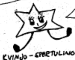
KVINJO - SPERTULINO