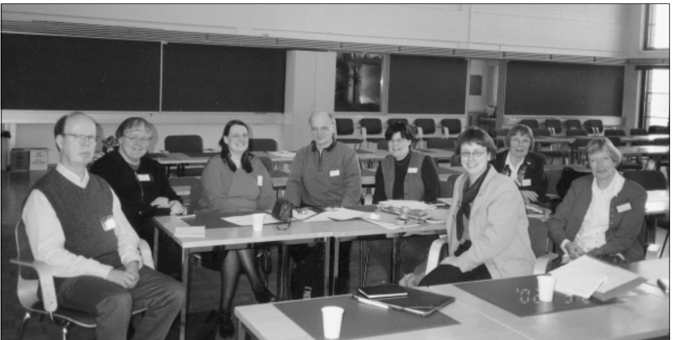
EAF:n uusi hallitus piti järjestäytymiskokouksen.