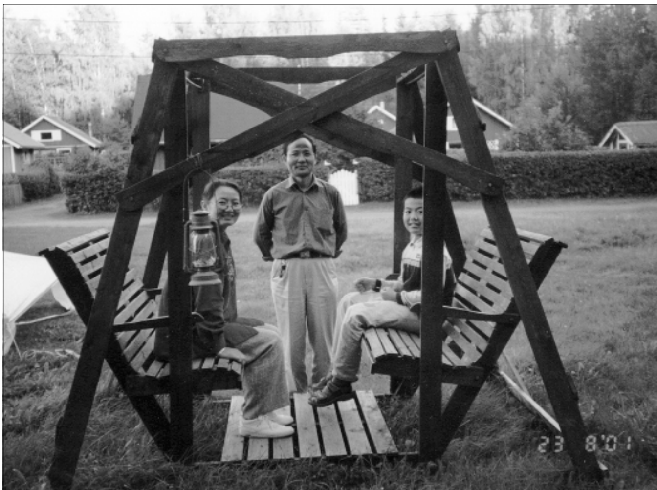
La familio Fan.

Pere de Esperanto mi konatiĝis kun mia edzino. Ni havas unu filon 10-jaran. La edzino kaj filo ankoraŭ loĝas en Xi'an.