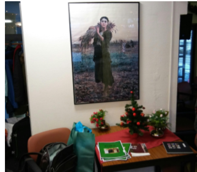
En la renkontiĝejo de Esperanto Noord-Nederland / Im Treffpunkt von Esperanto Noord-Nederland

Zamenhof, der Initiator der internationalen Sprache Esperanto, wurde am 15.12.1859 geboren. Weltweit veranstalten jährlich am 15. Dezember (oder kurz vorher oder nachher) Esperanto-Gruppen Feiern anlässlich dieses Geburtstags,