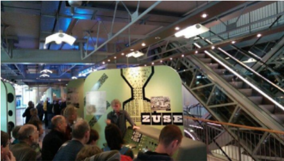
Ein Museumsführer erläutert von Konrad Zuse gebaute Rechenmaschinen / Muzeogvidanto klarigas kalkulmaŝinojn konstruitajn de Konrad Zuse

Etwa zwei Dutzend Esperanto-Freunde, überwiegend aus Niedersachsen, nutzten den dortigen arbeitsfreien Reformationstag und folgten der Hamelner Rattenfänger-Bande nach Paderborn. Erster Hauptprogrammpunkt war eine