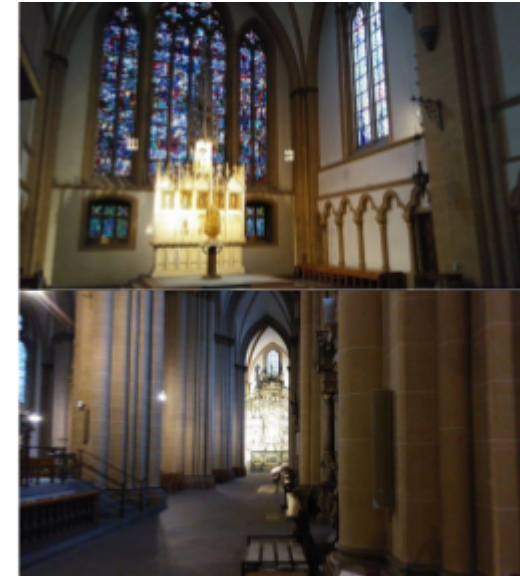
Impresoj el la katedralo de Paderborn / Eindrücke aus dem Paderborner Dom

Ĉirkaŭ du dekduoj da Esperanto-amikoj, ĉefe el Malsupra Saksujo, utiligis la tiean laborliberan Reformaciotagon kaj sekvis la Hamelenan Ratkaptistan Bandon al Paderborn. Unua programero estis vizitado de la plej granda komputila muzeo de l' mondo, de la Heinz Nixdorf MuseumsForum ( http://www.hnf.de/ ). Ĝi estis