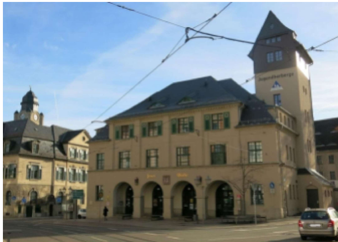
Plauen: junulargastejo / Plauen: Jugendherberge

Esperanto-Kurse (für Kinder, Anfänger und Fortgeschrittene), Vorlesungen (zu den verschiedensten Themen), Sport-, Musik- und Tanzübungen und unterschiedliche Handarbeits- und Bastelgruppen. Diese Angebote gibt es während der folgenden Zeiten: morgens vor dem Frühstück 30 Minuten, vormittags zweimal 90 Minuten und nach dem Abendessen vor dem Abendprogramm 60 Minuten. Der Nachmittag ist für Ausflüge (meist 2 Angebote pro Tag) vorgesehen, parallel findet das Jugendprogramm statt. Am Abend gibt es eine Kulturveranstaltung, danach wird ein Film mit Esperanto-Untertiteln in einem kleinen Kino vorgeführt. Besonders spannend in Plauen war eine