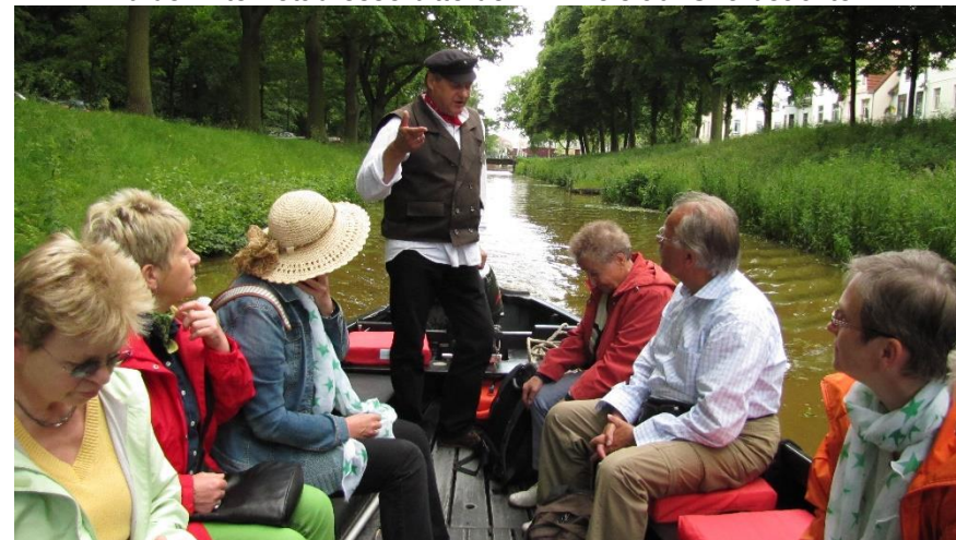
Bremen, 14.06.2014: Auf einem Torfkahn bei unserem Juni-Ausflug Bremen, 14a de Junio 2014: En torfŝipeto dum nia Junia ekskurso

Zu der Internetadresse bitte den Hinweis auf S. 8 beachten.