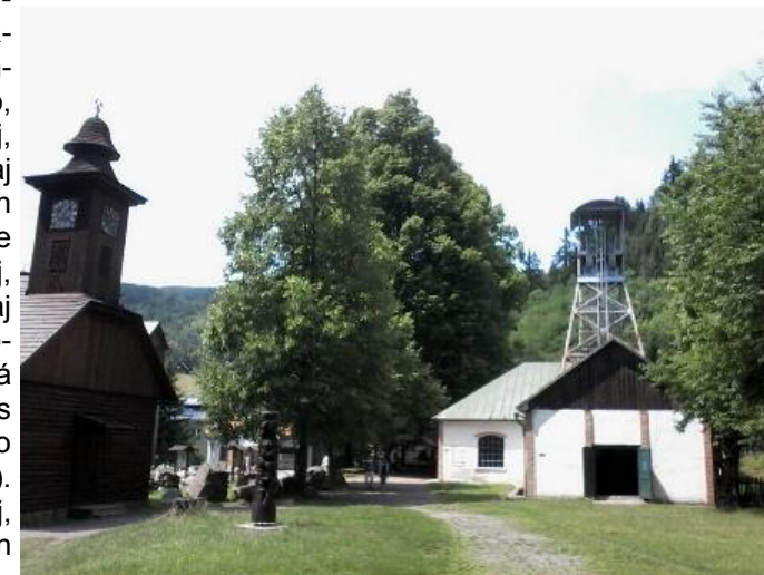
Bergwerksmuseum in Banská Štiavnica / Minejmuzeo en Banská Štiavnica

vingustumado, internacia vespero, nacia vespero kaj krome koncertoj, ĉi-foje de JoMo, Kimo kaj Kaši. La plej multaj aranĝoj okazis en konstruaĵoj apartenantaj al loka universitato; tie loĝis kaj krome maten-, tag- kaj vespermanĝis la plej multaj SES-partoprenantoj (temas pri studenthejmo). Funkciis jam de la posttagmezo ankaŭ drinkejo kun verando. Mi loĝis en hotelo situanta ses piedirminutojn norde. Estis ankaŭ paroligaj rondoj, sed eĉ sen ili apenaŭ eblis eviti la interparoladon en Esperanto, krom se oni ne sufiĉe posedis ĝin. La SES-2014-SK-partoprenantaro konsistis el proksimume 270 homoj de diversaj gepatraj lingvoj kaj aĝoj. Kompare kun ekzemple naciaj kaj universalaj kongresoj, SES al mi efikis "pli juna". Dum mia mallonga partopreno en SES mi sendis malmultajn pepojn, kiuj estas iel en rilato kun ĝi, kun la haŝtago #ses2014sk; iuj estas en Esperanto kaj/aŭ kun bildoj. Cetere: En Nitra okazos la Universala Kongreso de Esperanto en 2016. – Andreas