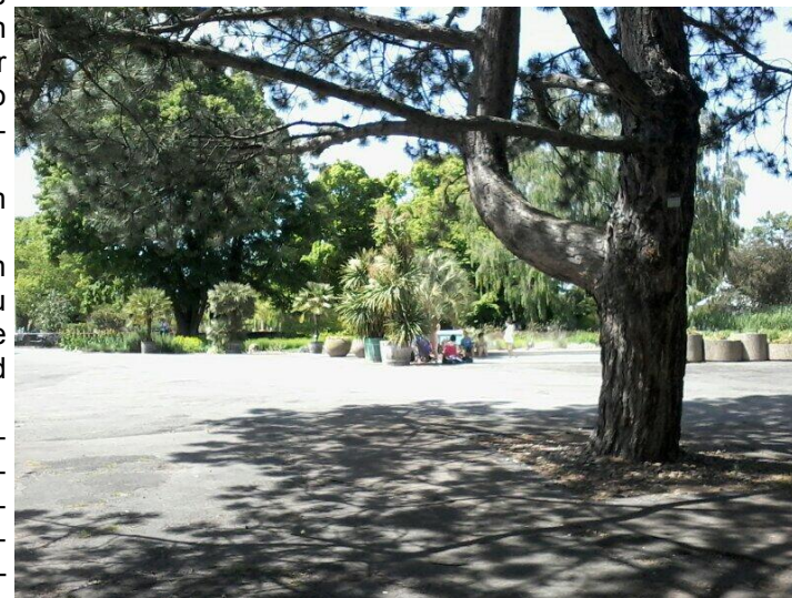
En egapark Erfurt / Im egapark Erfurt