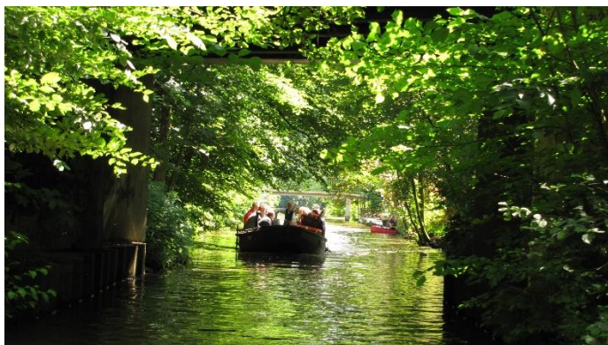
Verfolger-Torfkahn / Torfŝipeto de postĉasantoj

Im Rahmen unseres Juni-Ausflugs nahmen wir an einer Torfkahnfahrt teil. Wir starteten in Bremen-Findorff und fuhren durch eine malerische Landschaft auf dem