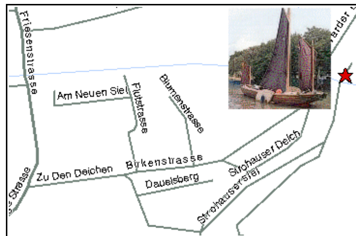
Abbildung 2 / Ilustraĵo 2: (Fortsetzong von S. 6, Abbildung 1 / daŭrigo de paĝo 6, ilustraĵo 1) Zu den Deichen (ganz bis zum Deich durchfahren / traveturu tute ĝis la digo) -> (nach links in / maldekstren al) Strohauser Deich (nach wenigen Metern / post malmultaj metroj) -> Strohauser Siel (Deichüberfahrt / digtransveturejo) -> Treffpunkt (roter Stern) / renkontiĝejo (ruĝa stelo)

En la 1995-a jaro Alfred Dietrich kaj dek tri pliaj fondint-membroj fondis la klubon Esperanto-Grupo Subvisurgo. Je la 4-a de Junio 2005 ni tion festos en Rodenkirchen (paĝo 6, ilustraĵo 1) kaj invitas. Ni renkontiĝos je la 11:00 horo ĉe la gastejo „ Am Sporthafen “, Strohauser Siel (ilustraĵo 2). Tie ni tagmanĝos kaj povos partopreni ekskurson per la tabulŝipo Hanni (ilustraĵo 2) kaj esplori la sub-Wezer-regionon. La posttagmezon estos la prezento de “shanty”-ĥoro, kafo kaj kuko. – Kosto (Hanni, tagmanĝo, kuko): 15 €; aliĝo: paĝo 8.