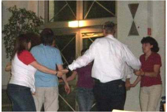
Kleine Gruppe, Riesenspaß: bambumado / Malgranda grupo, plezurego: bambumado

Ich fand interessante Bücher, und unser Verein wurde mit ansprechenden, ganz neuen Esperanto-Informationsbroschüren ausgestattet. Das Konzert von La Kuracistoj und das Tanzen mit einem bambumado (Gruppentanz mit Küssen!) waren großartig. Sonnige Stadt, sympathische Leute, tolle Stimmung: gerne wieder." – Andreas' acht Vereinskameraden machten Ausflüge.