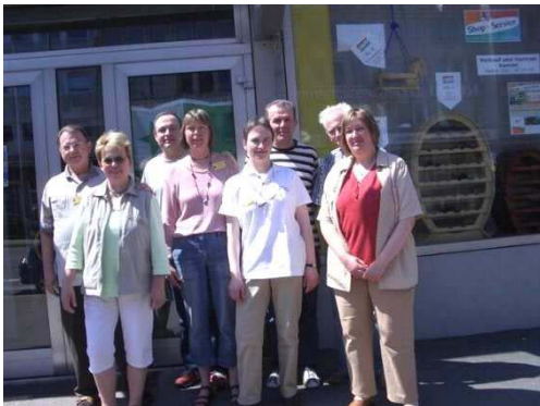
Kongressteilnehmer aus unserem Verein I Kongresanoj el nia klubo

nia klubo estis provizita per plaĉaj, tute novaj Esperanto-informbroŝuroj. La