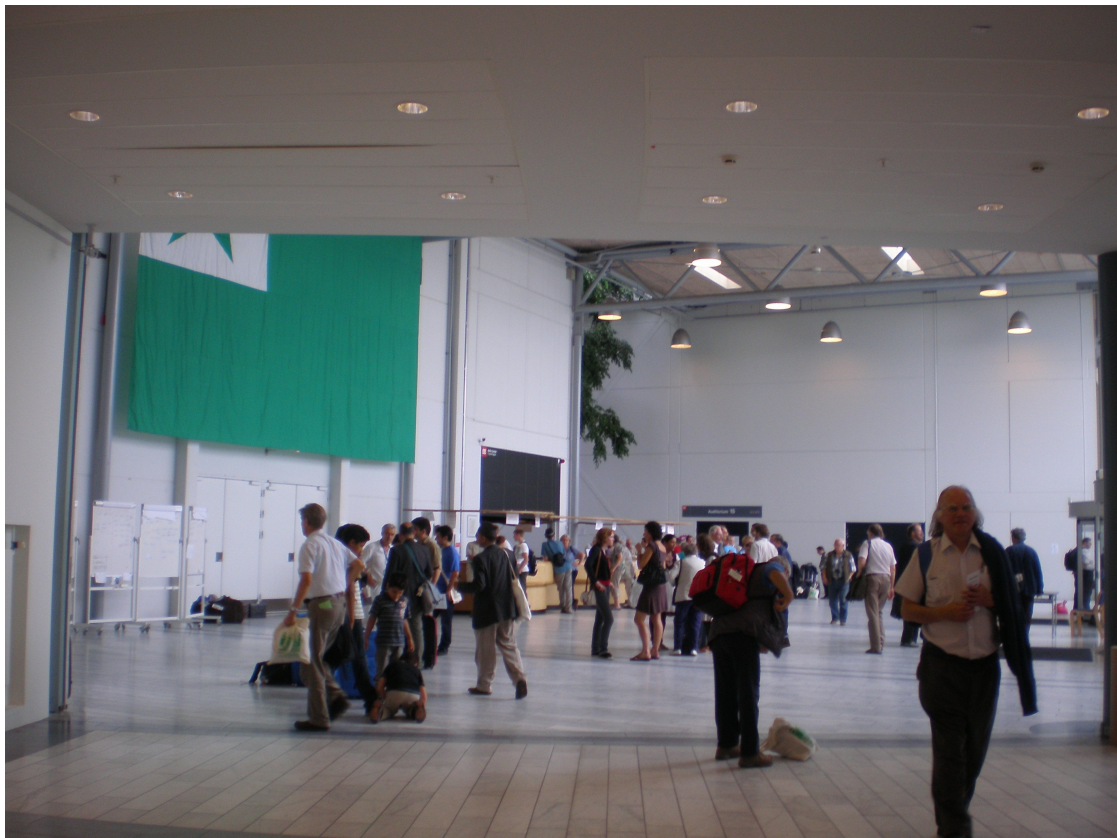
La enir-halo. Fone la akceptejo. Pro fajrobrigada postulo, oni ne povis havi la grandan flagon en salono Zamenhof.