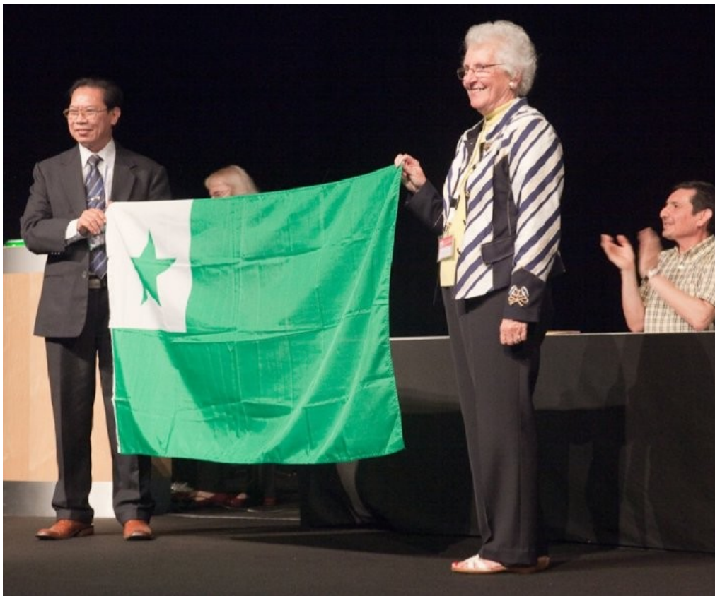
Jen la kongresa flago estas solene transdonata al Hanojo.