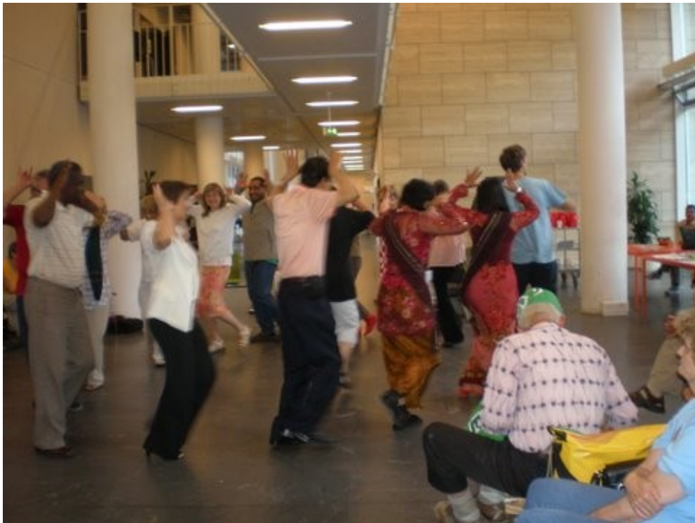
La ILEI-konferencanoj kune dancas en la universitata koridoro.