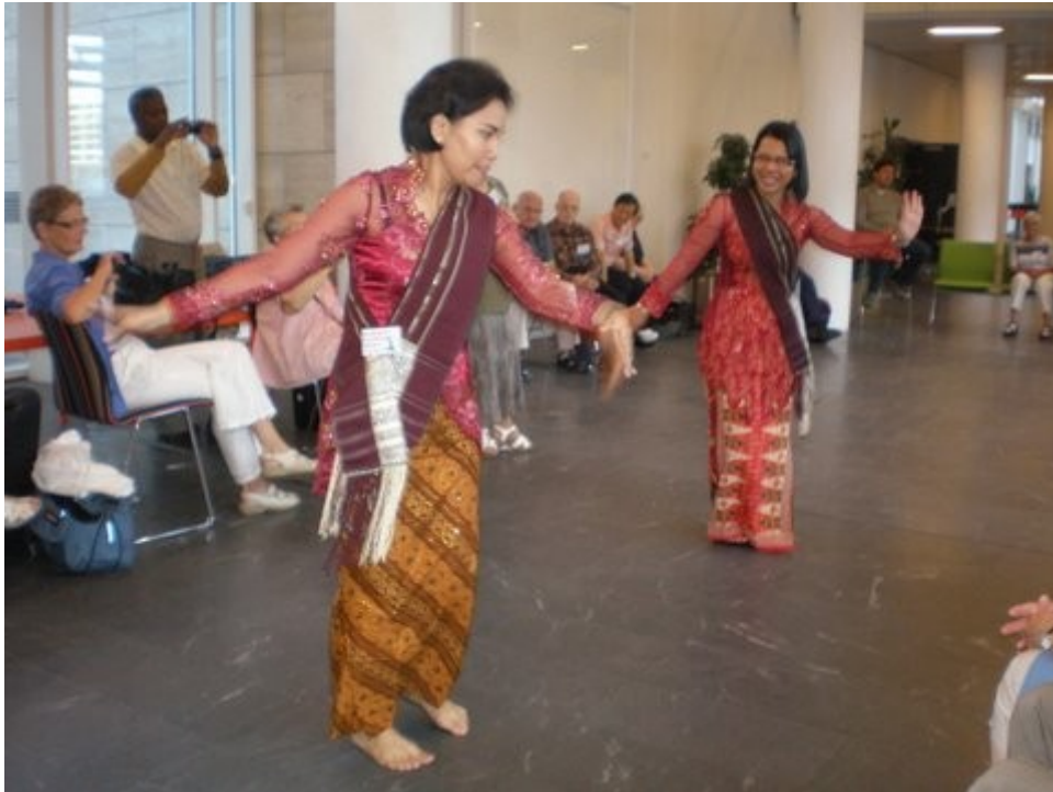
Du indonezianinoj prezentas tradician dancon en la ILEI-konferenco.