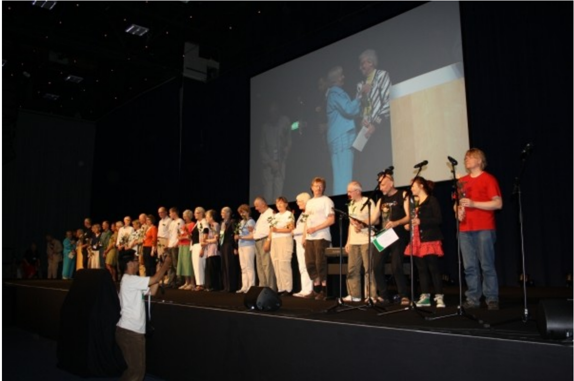
En la solena fermo, ĉiu kunlaborinto ricevis rozon.