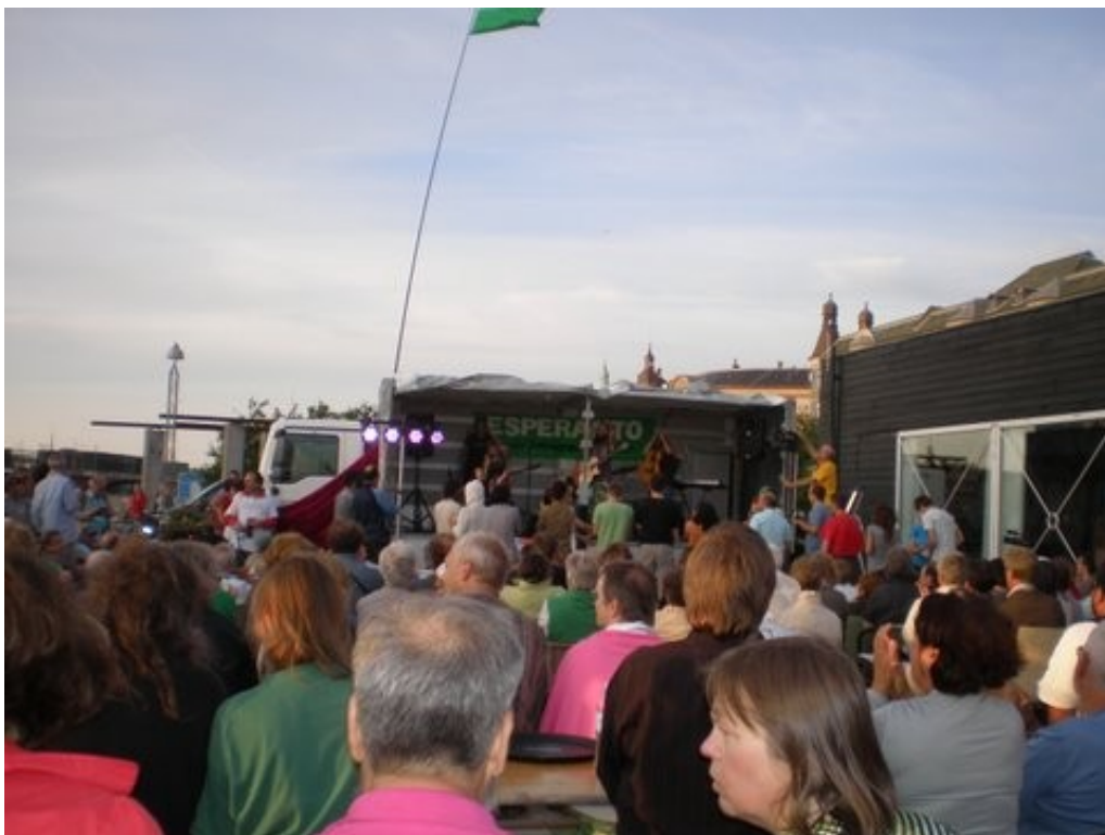
Merkrede Esperanto Desperado publike koncertis ĉe la kulturdomo de Islands Brygge.