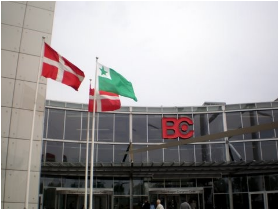
Danaj kaj Esperanta flagoj antaŭ la kongresejo.