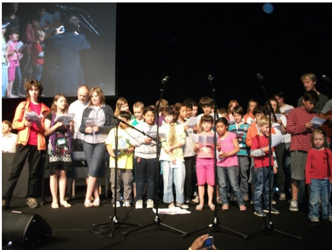
La partoprenintoj de la Infana Kongreseto kantis por ni.