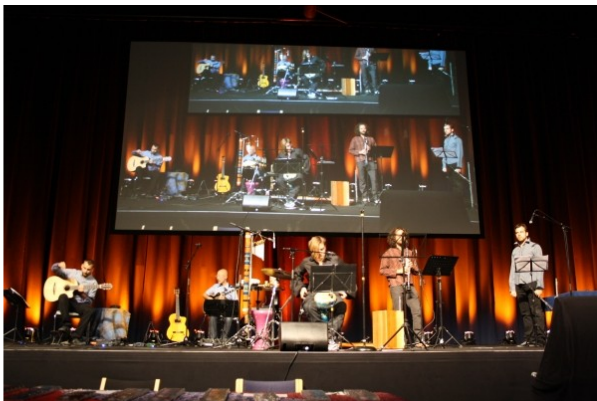
La itala bando kun franca nomo “Rêverie” muzike revigis nin.