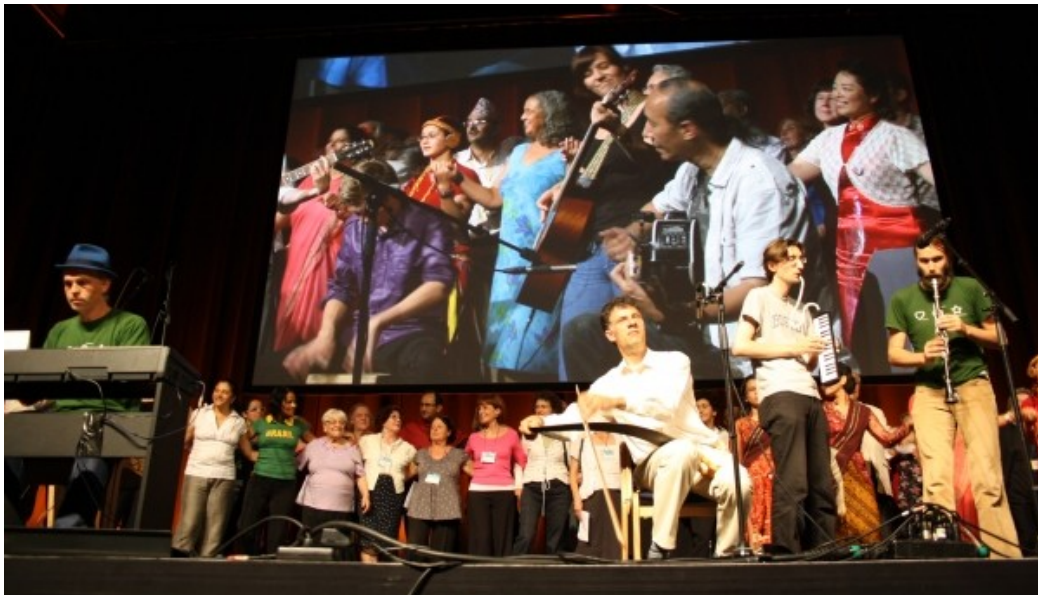
Ĉiuj artistoj sur la scenejo por la fina numero

Unu el la plej oftaj konversaciaj temoj estis la vetero, kiu skurĝis la tutan semajnon escepte de la ekskursita tago, merkredo. Tamen eĉ la malbela vetero ne sukcesis detrui la bonan etoson. Multaj reagoj jam venis; kelkaj el la reagantoj kontentiĝis pri la bonega programo kaj la helpemeco de la aranĝantoj. Kelkaj grumblis pri ‘malglataĵoj’ kaj pri la tro granda disvastiĝo de la angla en Danio. Kion ni faru? Eĉ idealismaj esperantistoj estas nur homoj, kaj Utopio ne jam troviĝas!