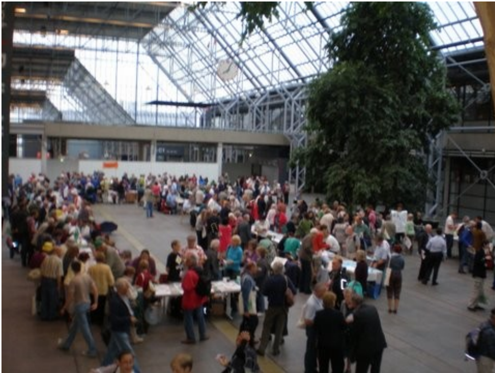
La Universala Kongreso komenciĝis per Movada Foiro, kiu okazis en la granda halo de la Bella-Centro.