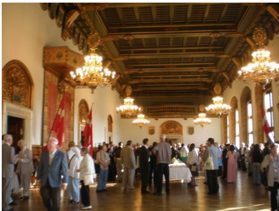
Akcepto de invititoj en la urbodomo.