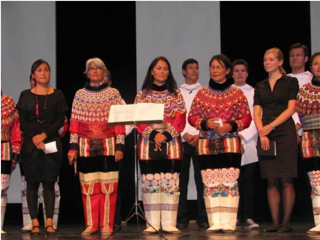
La gronlanda koruso "Aavaat" kantis por ni en la nacia vespero.