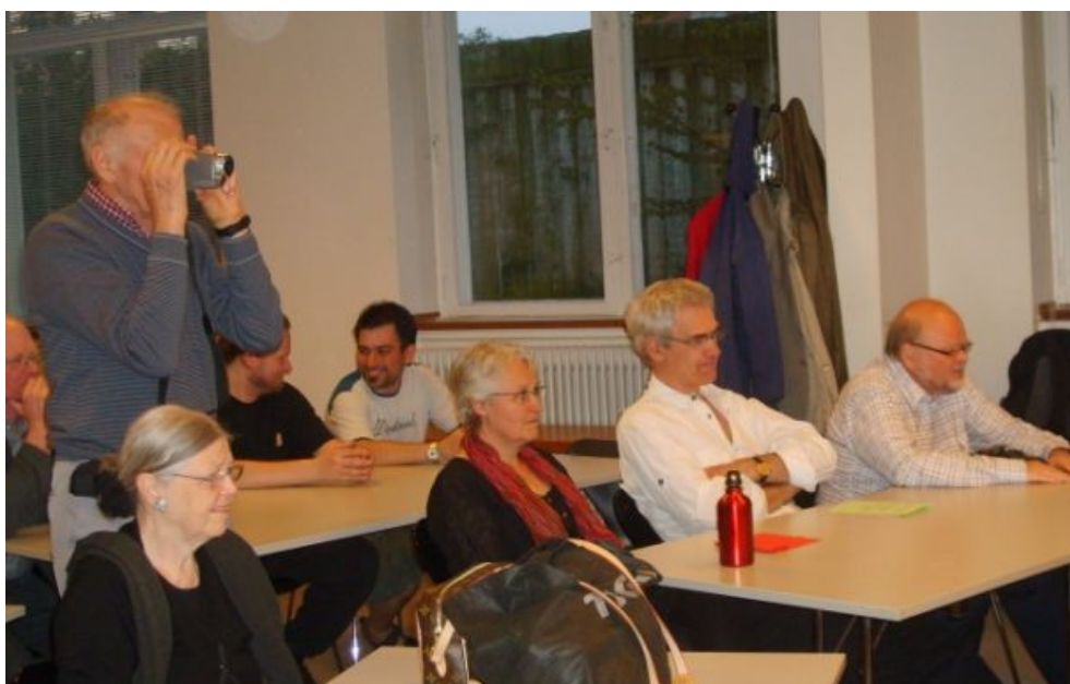
DEA-membroj aŭskultas preleganton