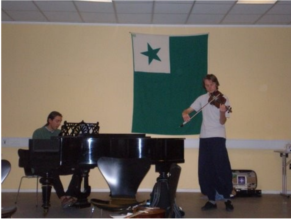
La fratoj Dalmose koncertas en la jarkunveno