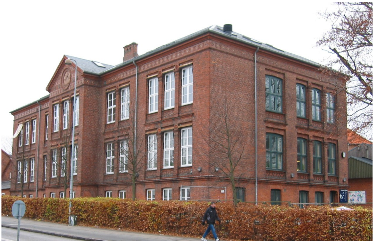
La ĉefKEFejo, Skolen ved Kongevejen en Helsingør