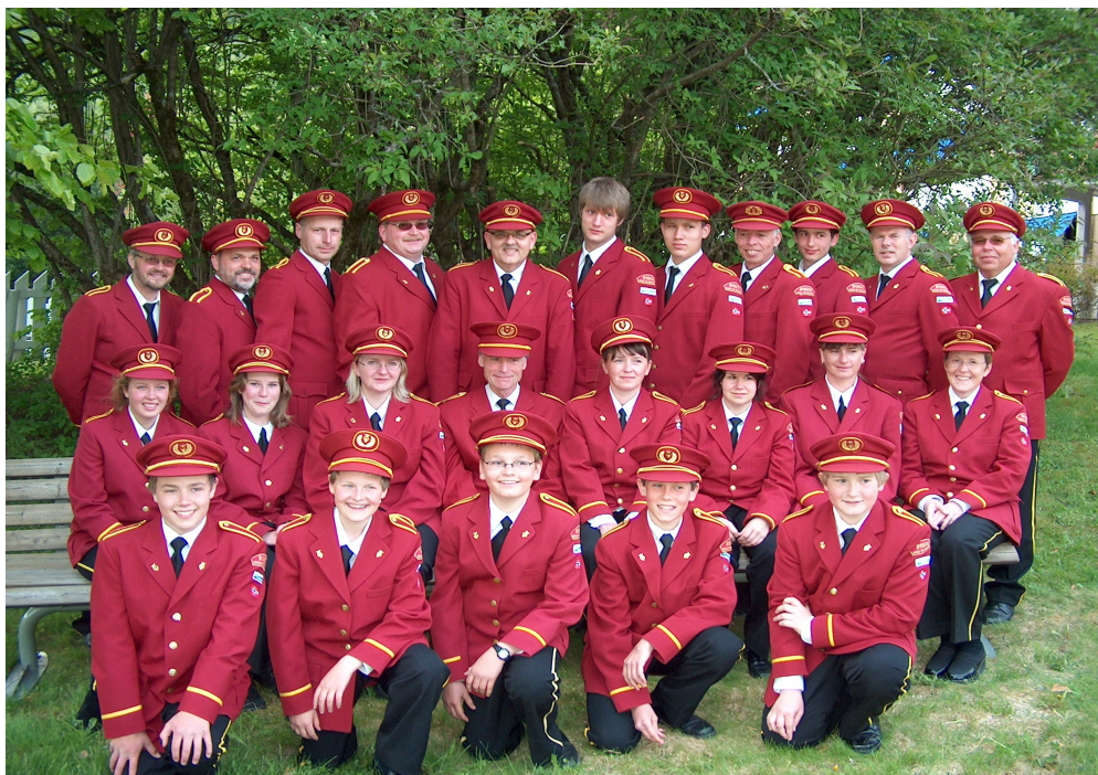
Bygstad Skule- og Hornmusikk, Bygstad, Norvegio